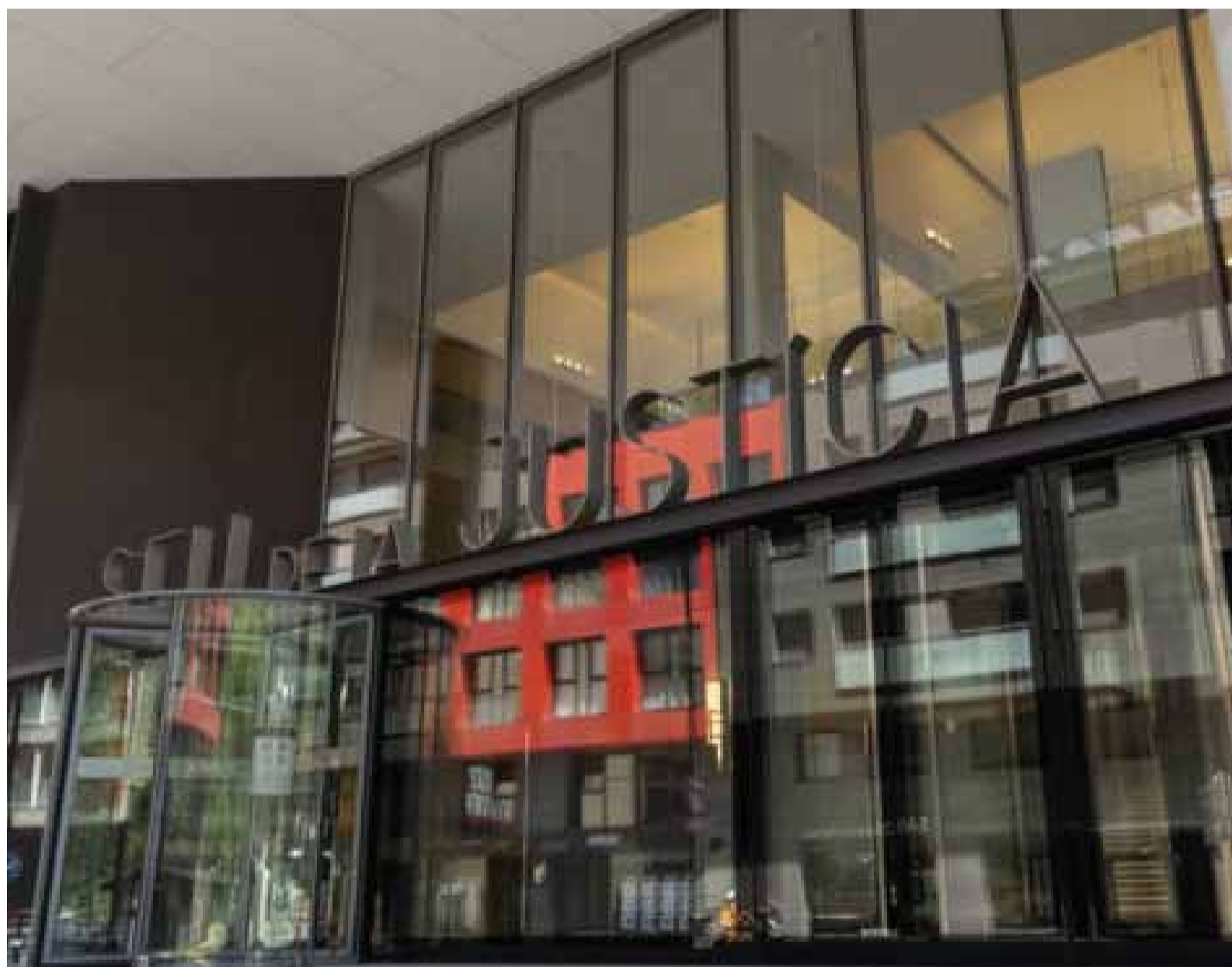
La Seu de la Justícia.

Va ser durant aquest segon accés a l'aparcament quan es van produir les discrepàncies amb els propietaris de l'espai, una situació que, segons la versió policial, va dificultar reiteradament l'execució de la seva tasca. Els processats, els quals s'enfronten a una petició de 18 mesos de presó condicional i d'inhabilitació per exercir càrrec públic, sostenen que l'actitud de la dona, culminada amb el qualificatiu de «maleducats» adreçat als agents, va ser «la gota que va vessar el got» després de nombroses dificultats durant la intervenció i va motivar la decisió de tramitar una contravenció penal. La policia acusada, incorporada al cos l'any 2019, ha explicat que tant ella com el seu company van informar la dona que havien de formalitzar una diligència de