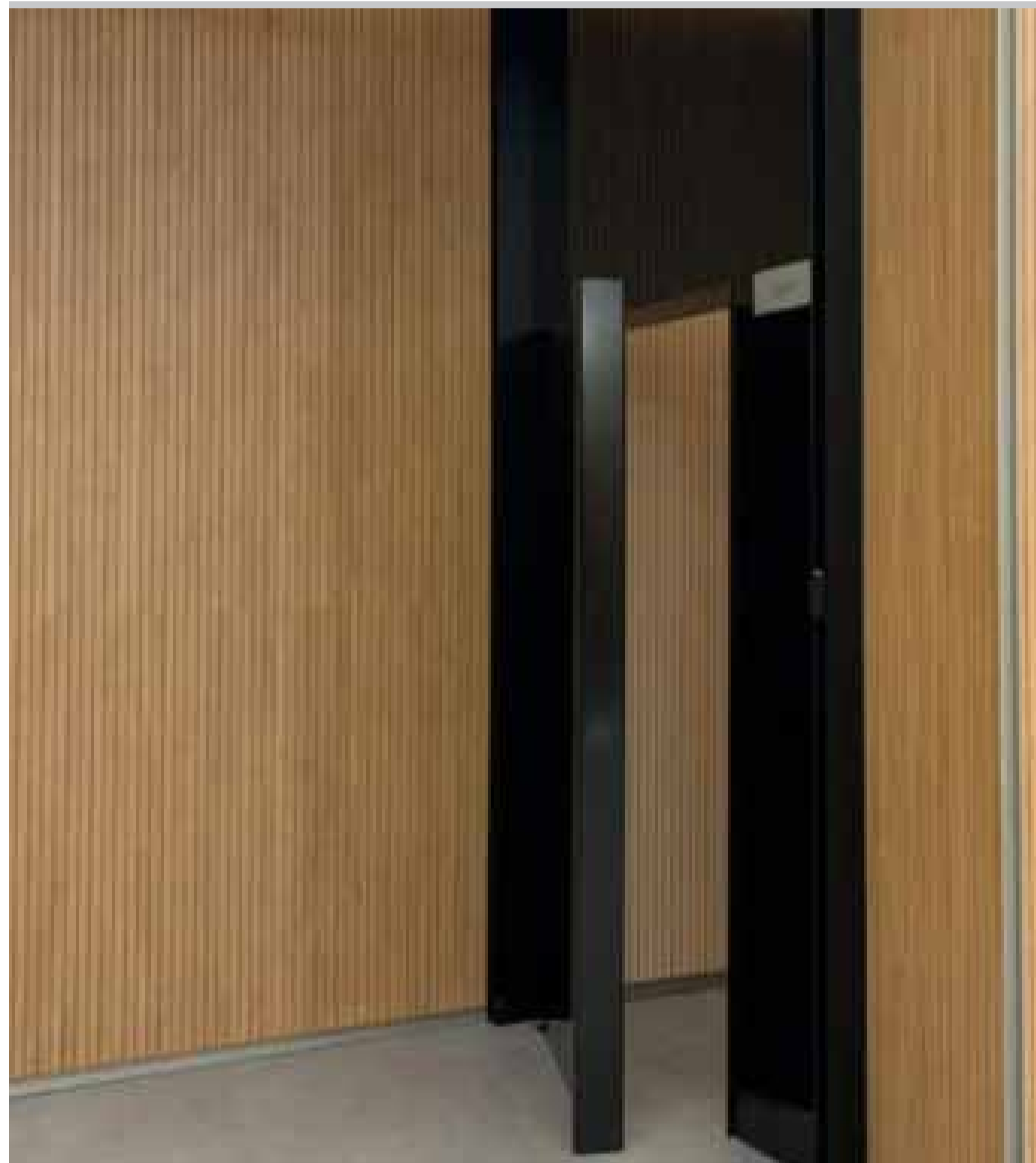
L'interior de la Seu de la Justícia.

La segona jornada del judici contra dos agents de policia acusats de detenció il·legal i tracte denigrant ha estat marcada per una pregunta recurrent al llarg de la vista: què és una detenció? La qüestió ha centrat bona part de les declaracions d'agents, comandaments i excàrrecs del Cos de Policia que han comparegut davant del Tribunal de Corts. Tot i que pugui semblar una pregunta evident, el debat ha resultat clau per entendre unes actuacions que es remunten al 2020, abans de la modificació dels criteris interns introduïda l'any 2023 en matèria de contravençions penals. La normativa actual estableix que, davant d'una contravençió penal, la persona afectada ha d'autoritzar expressament el seu trasllat a dependències policials per completar les diligències. Abans d'aquest canvi, però, era habitual que els agents requerissin la presència