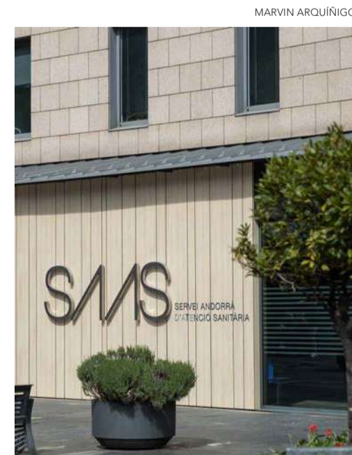
Les dependències del SAAS.