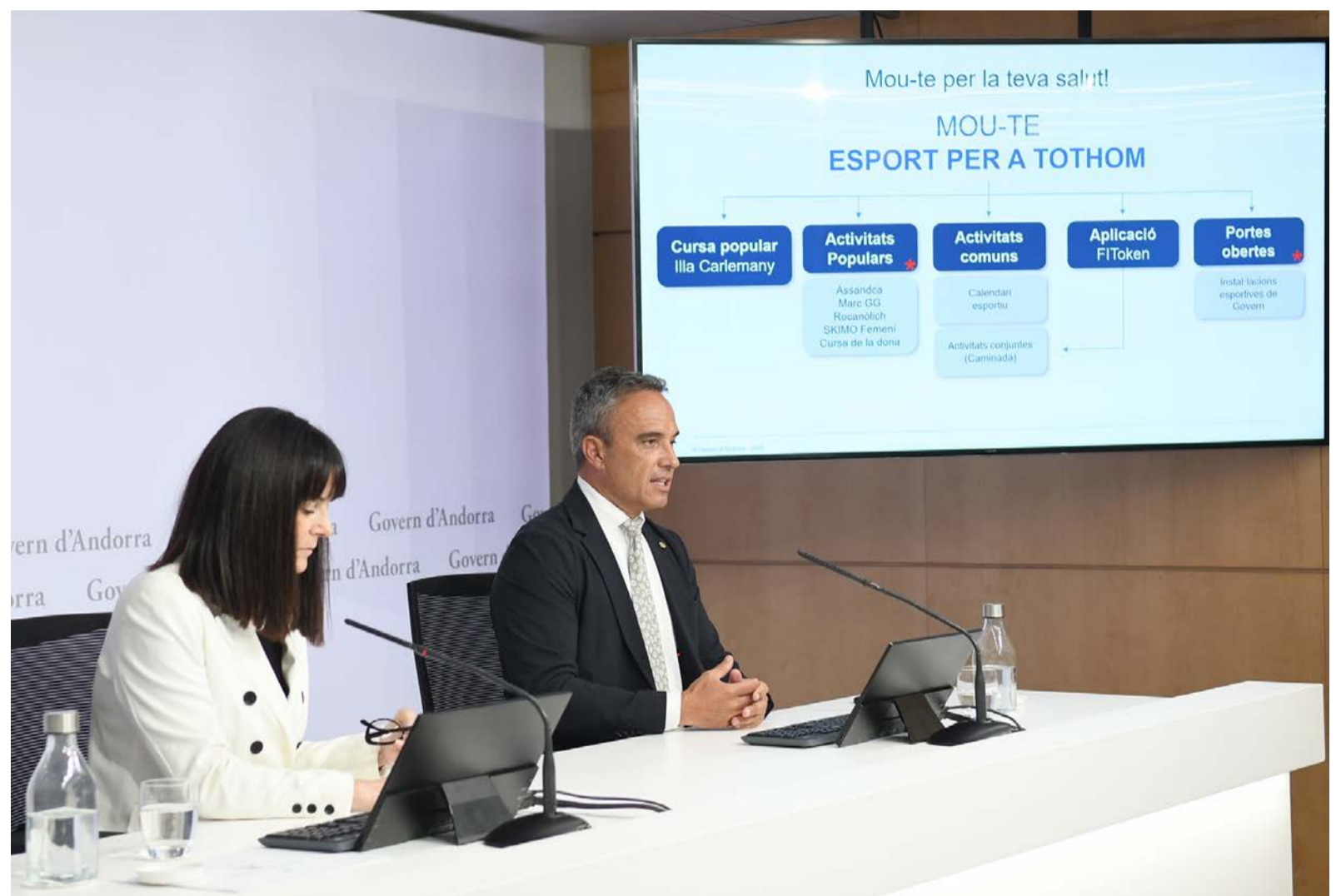
La ministra de Cultura, Joventut i Esports, Mònica Bonell, i el secretari d'Estat de Joventut i Esports, Alain Cabanes, durant roda de premsa.

El Govern ha presentat aquest dimarts una nova edició de la iniciativa 'Mou-te per la teva salut', la qual arrenca aquest dissabte 25 d'abril a l'Estadi Nacional amb una jornada de portes obertes pensada per a famílies i ciutadania en general. El projecte, impulsat pel Ministeri de Cultura, Joventut i Esports, fa un pas més enllà amb un enfocament inclusiu i personalitzat, especialment adreçada a joves en situació de risc i a persones amb discapacitat. La ministra de Cultura, Joventut i Esports, Mònica Bonell, ha remarcat que la iniciativa s'emmarca en l'objectiu d'aconseguir que Andorra esdevingui "el primer país 100% en forma per a la vida", inspirat en el programa 'Fit for Life' de la UNESCO. En aquest sentit, ha recordat que el projecte va néixer el 2021 amb les marxes populars i que, actualment, "hem estimat que el 80% de la població en algun moment està fent activitat", fet que ha portat el Govern a centrar-se en el 20% restant de cara a assolir la fita del 100% al 2027. "Ens vam posar un altre repte d'identificar de quins col·lectius estàvem parlant i veure si també podíem arribar amb aquest objectiu final del 100%", ha assegurat la ministra. Així, després d'impulsar accions per a la gent gran, enguany el focus se situa en joves en risc i persones amb discapacitat, col·lectius que fins ara quedaven més allu-