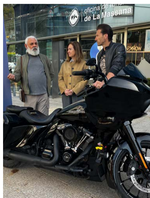
Hi haurà una concentració de motocicletes.