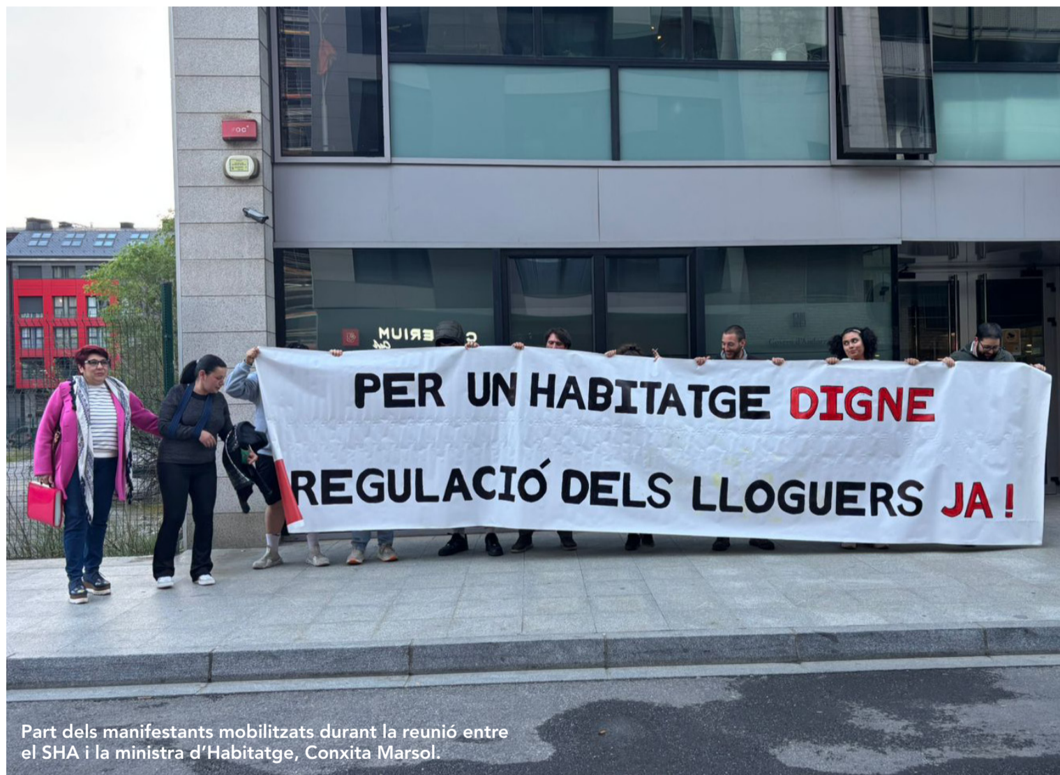
Part dels manifestants mobilitzats durant la reunió entre el SHA i la ministra d'Habitatge, Conxita Marsol.