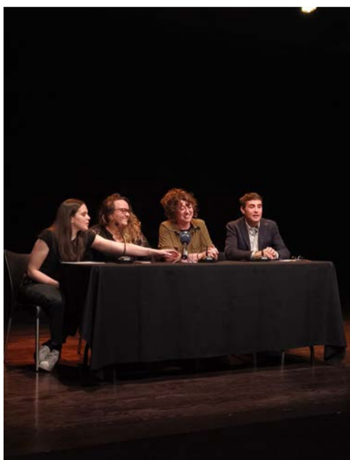
La presentació de la temporada 2026.