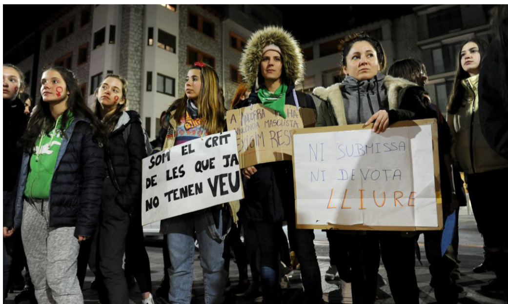
Una de les darreres manifestacions per l'avortament.