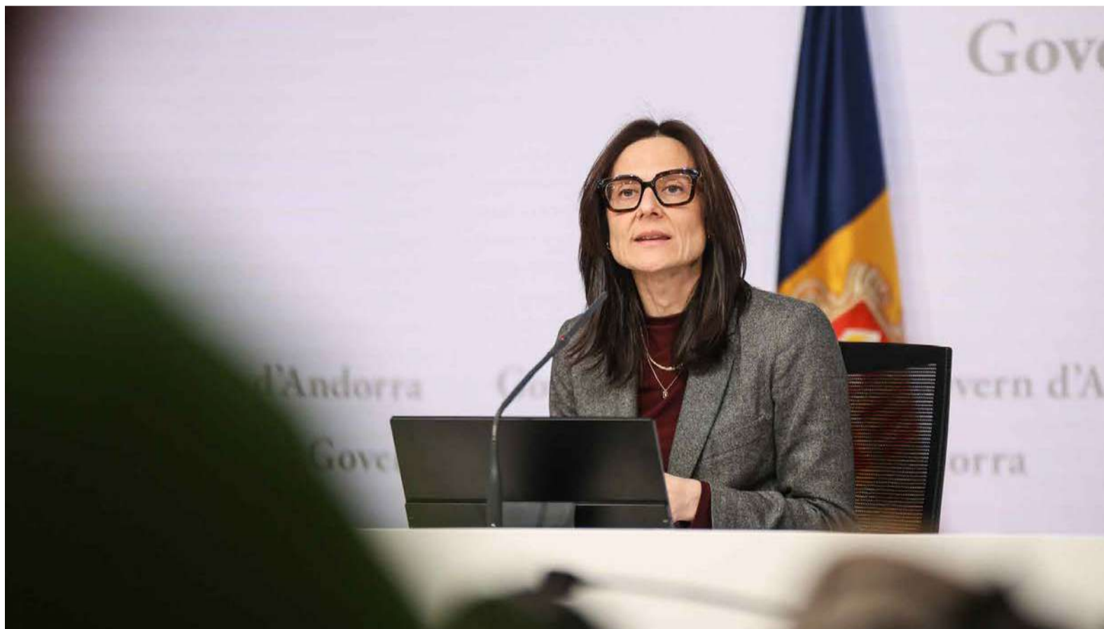
La ministra de Justícia i Interior, Ester Molné, aquest matí a la sala de premsa de Govern.