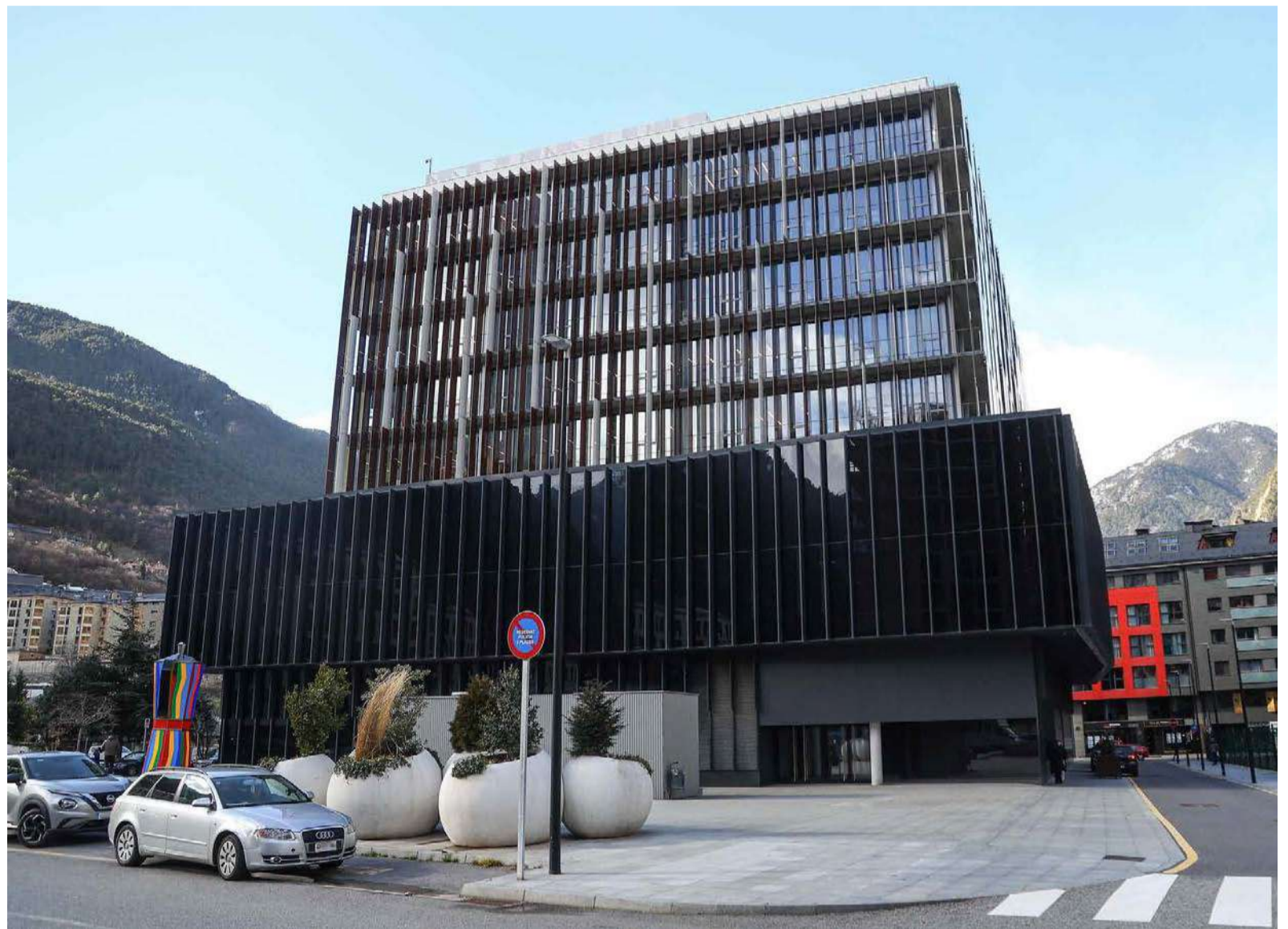
La seu de la Justícia, a Andorra la Vella.

Durant la vista, la víctima ha descrit un període prolongat de violència física i psicològica, amb episodis d'agressions, persecucions pel carrer i amenaces de mort, fins i tot en presència del fill. Segons el seu testimoni, l'acusat li proferia expressions com "te voy a matar" mentre la