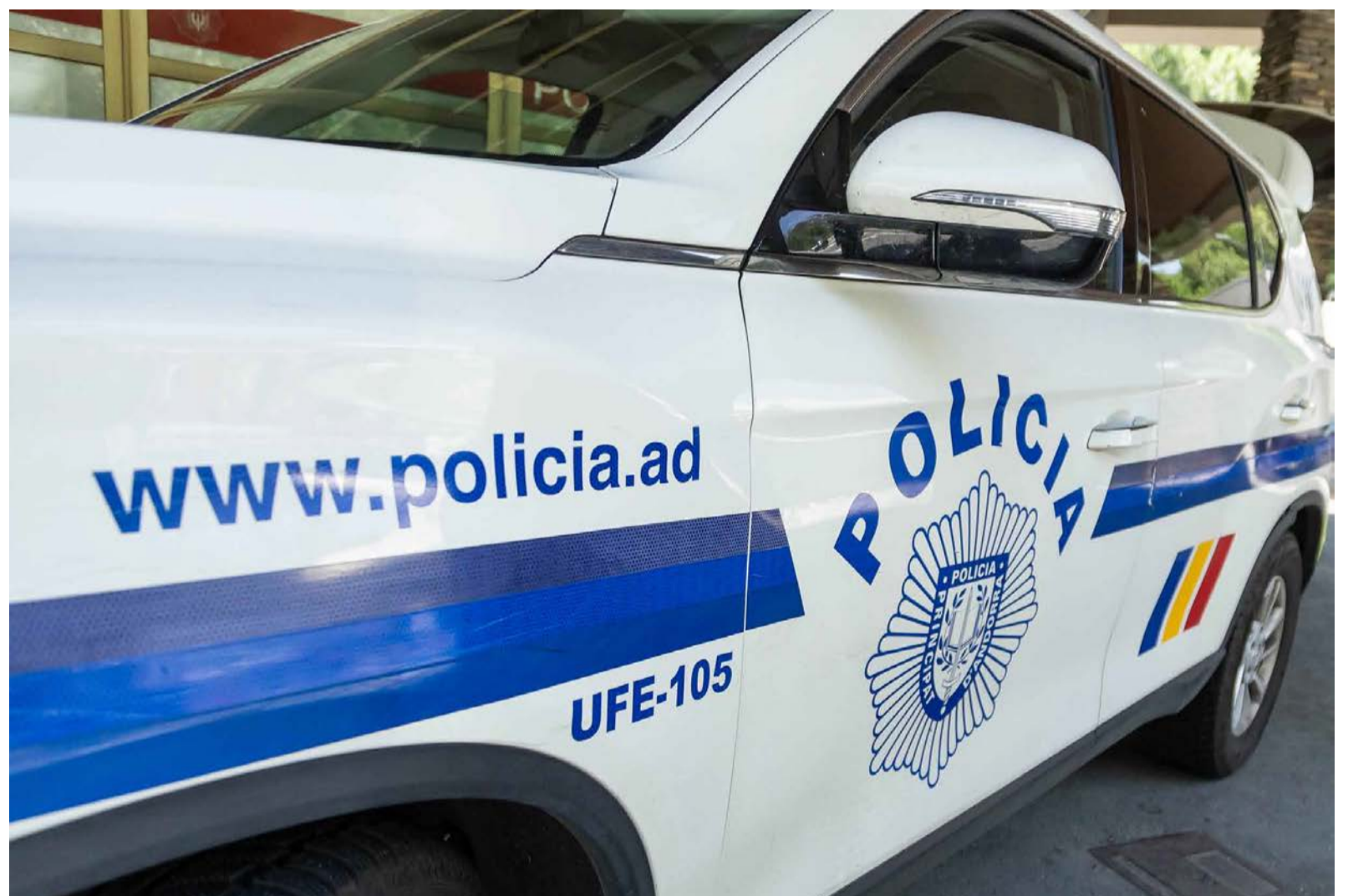
Un vehicle de la Policia.

En la fugida, els individus han patit un accident, en principi lleu amb un altre vehicle. Seguidament, els agents han pogut controlar un dels implicats al mateix lloc dels fets, mentre que els altres dos han fugit a peu. Posteriorment, s'ha desplegat un dispositiu de recerca que ha permès localitzar i detenir un segon sospitós, quedant el tercer fugat. A hores d'ara, la Policia manté l'operatiu actiu en diferents punts del Principat, més centrats a la parròquia laurediana (encreuament de Fontaneda), per intentar localitzar el tercer implicat que encara es tro-