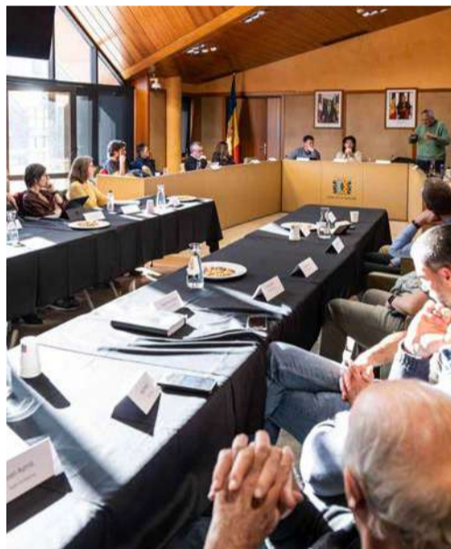
El comú ha presentat el document.

del teixit existent. El document defineix cinc línies d'actuació: ordenar la mobilitat, integrar patrimoni i paisatge, garantir un repartiment equilibrat dels equipaments, dimensionar el creixement segons les necessitats reals i adaptar la regulació del sòl i de l'edificació.