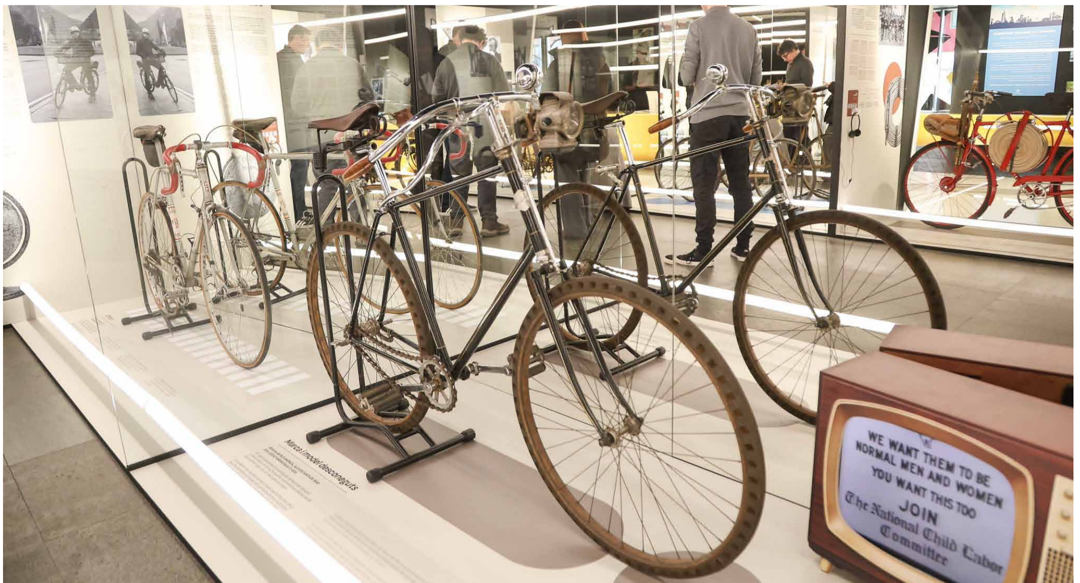
Una de les bicicletes exposades.