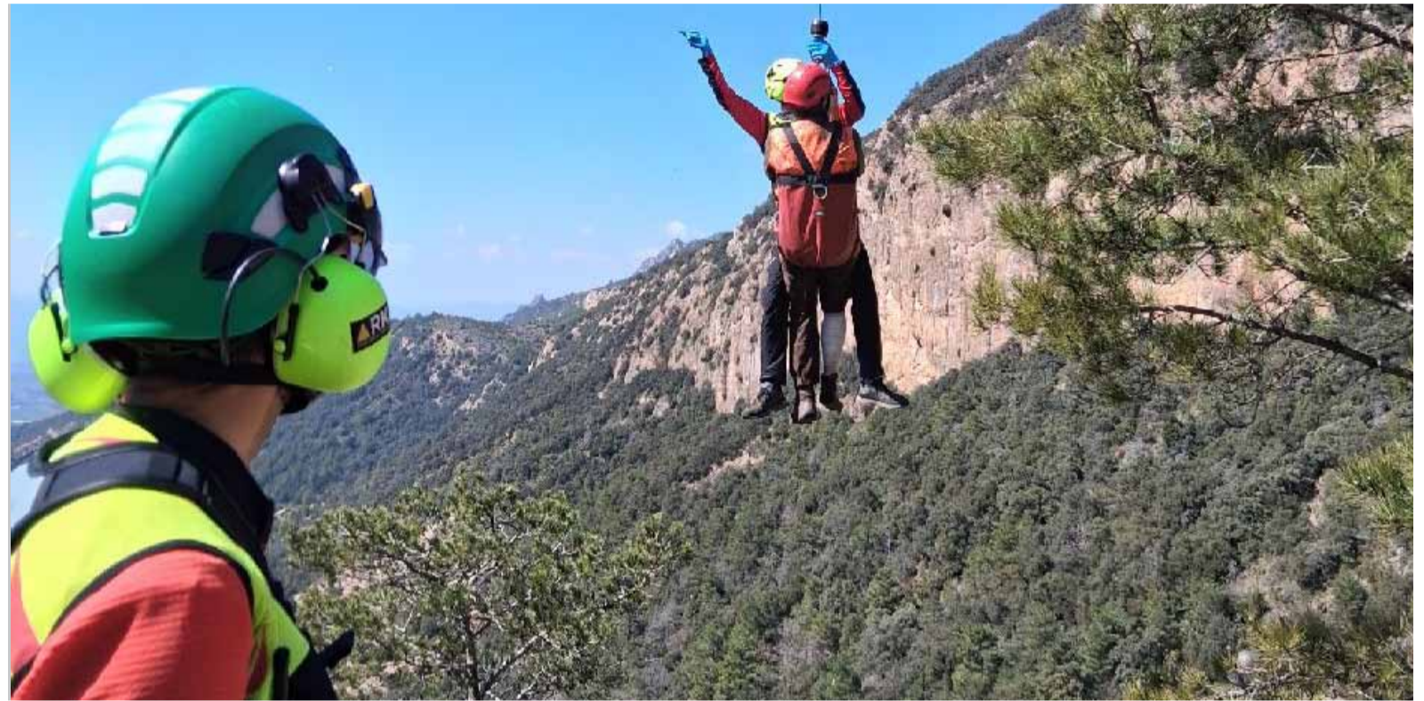
El moment de rescat del caçador ferit.

En aquest sentit, Cabanes recorda que es tracta d'un animal robust i potent. A Andorra i Catalunya, un porc senglar pot pesar habitualment entre mig quilò fins a 110 quilos, tot i que en casos excepcionals pot superar els 150. Malgrat que no sigui es-