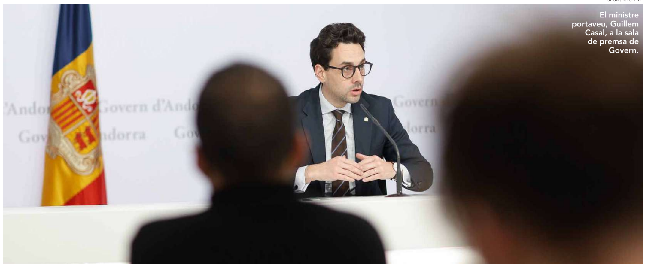
SFGA / CESTEVE