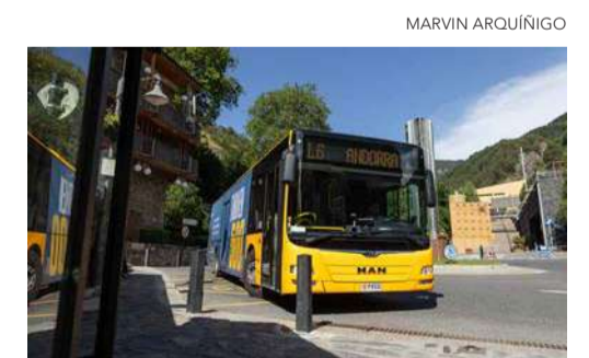
Un bus de la línia nacional L6.

analitzant" l'evolució del transport públic amb la voluntat "d'oferir un millor servei" a la ciutadania. En aquest context, el ministre portaveu ha recordat que el país travessa aquests dies "una situació meteorològica complexa", un factor que pot dificultar el trànsit rodat i que,