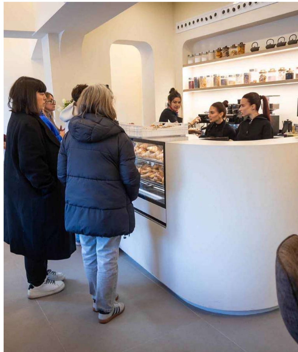
Les instal·lacions de la cafeteria.