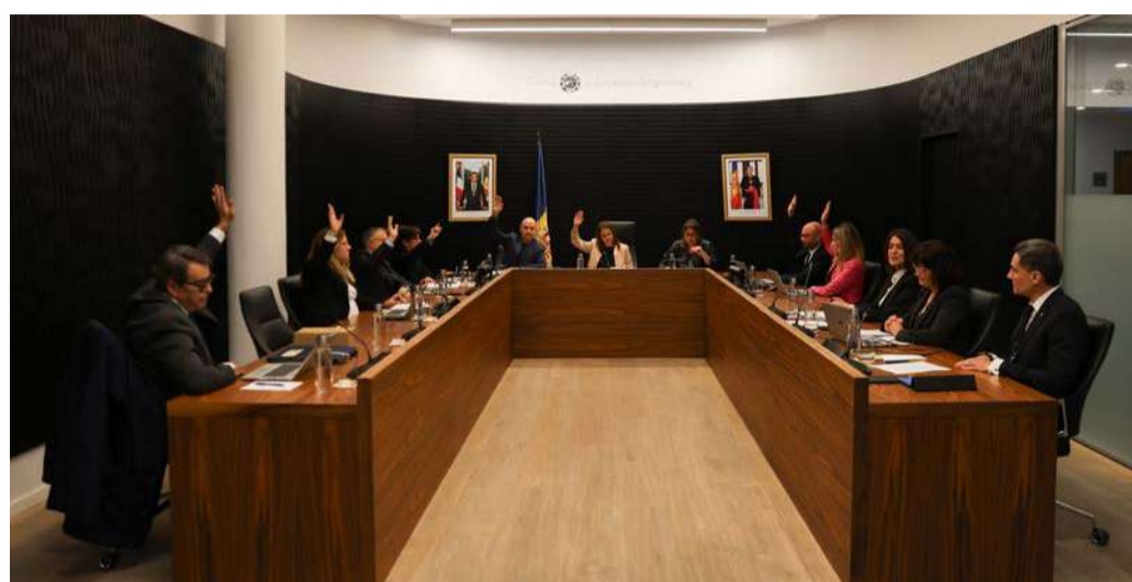
Un instant del Consell de Comú d'Escaldes-Engordany.