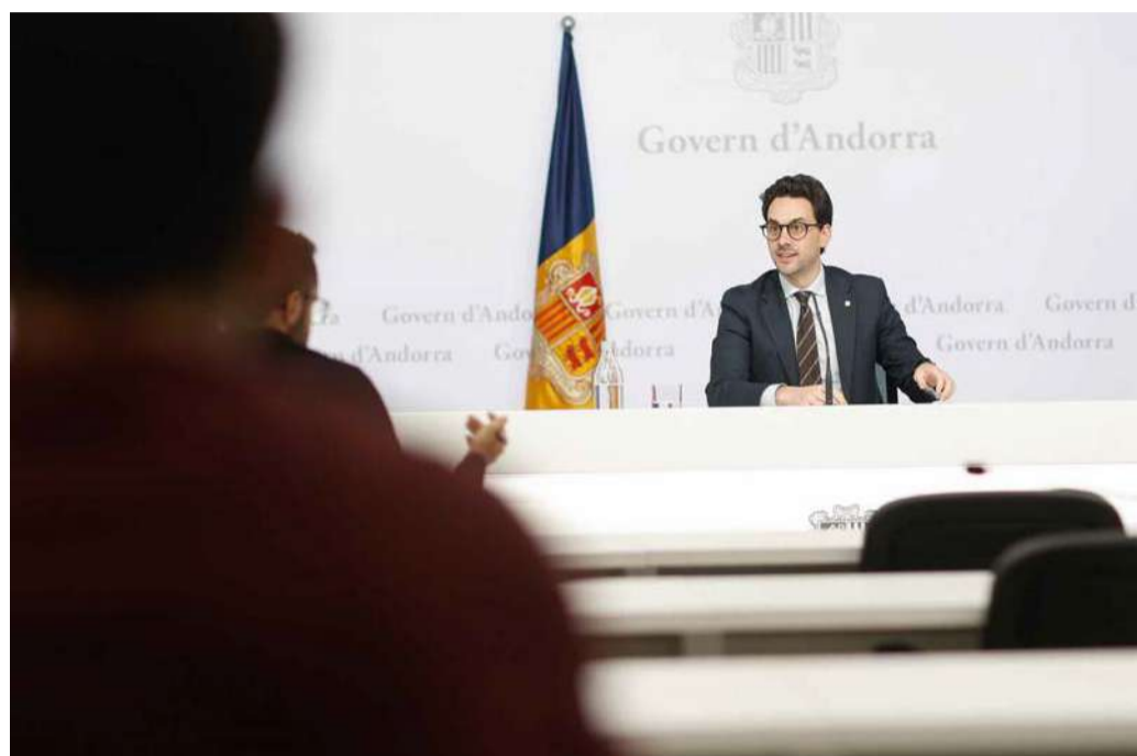
Guillem Casal, durant la roda de premsa posterior al Consell de Ministres.

El ministre portaveu, Guillem Casal, ha defensat aquesta decisió argumentant que es tracta d'"una situació nova", ja que suposa començar a desintervenir progressivament els lloguers després d'anys de congelació. "Tenim marge perquè els lloguers estaran conge-