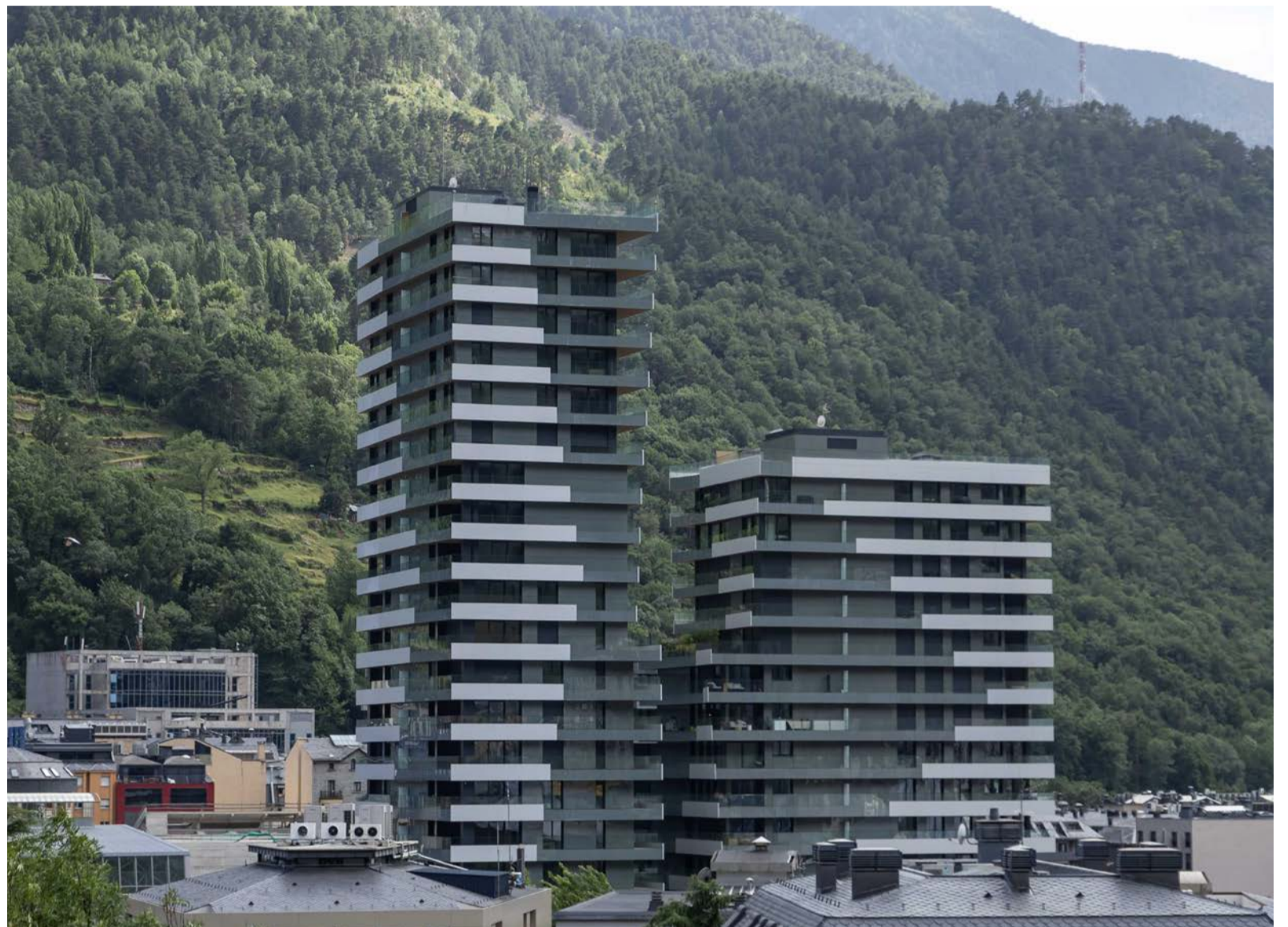
Dues de les actuals torres d'Escaldes-Engordany.

En aquest punt es pot fer esment de les declaracions del ministre portaveu, Guillem Casal, després del Consell de Minis-