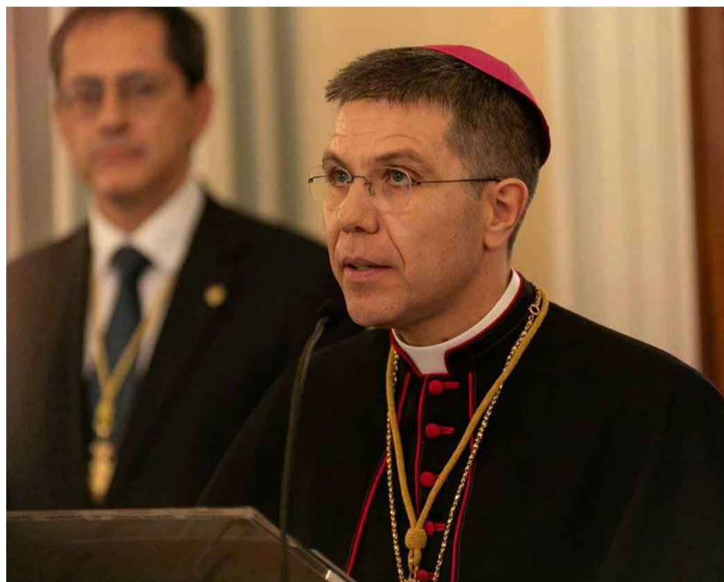
El copríncep episcopal, Josep-Lluís Serrano.