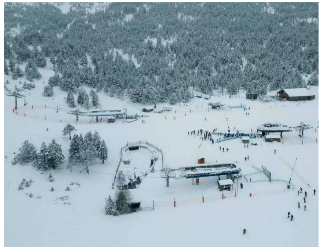
Situació actual de les pistes de Pal Arinsal.

Pel que fa a l'estat de les pistes, les precipitacions caigudes de manera constant els darrers dies han deixat entre 25 i 40 centímetres de neu nova, amb acumulacions que arriben a prop del mig metre a les zones més beneficiades. Aquestes xifres han superat les previsions inicials i permetran ampliar l'oferta esquiable en els prò-