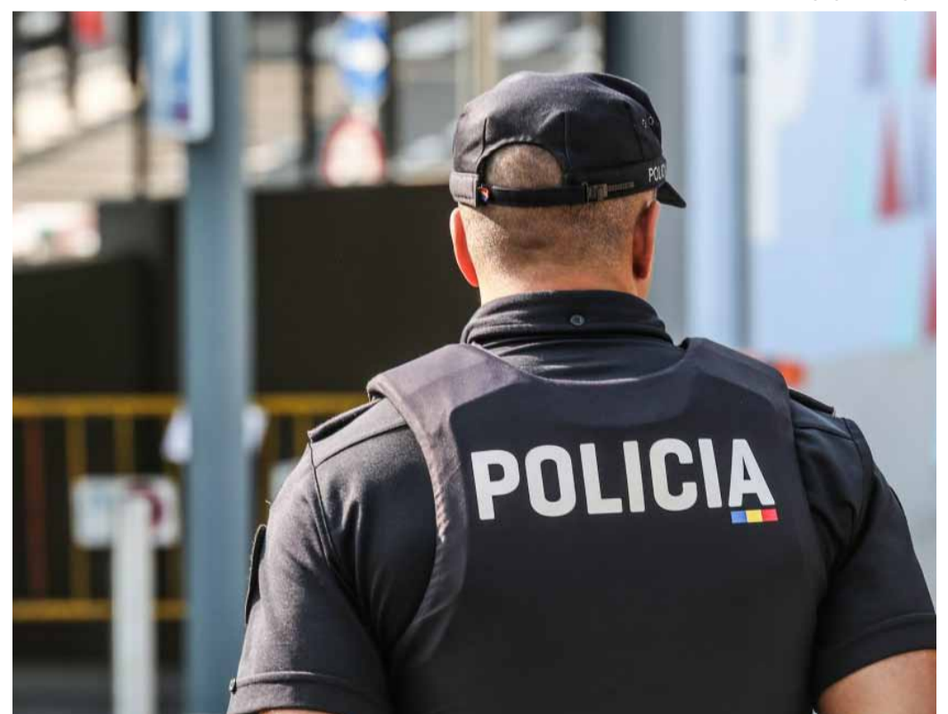
L'objectiu a llarg termini és garantir una immigració regulada.

Tot i això, cal recordar que el Govern sí que ha expressat en diverses ocasions la voluntat d'intensificar els controls migratoris. No obstant això, segons les mateixes fonts policials, fins ara