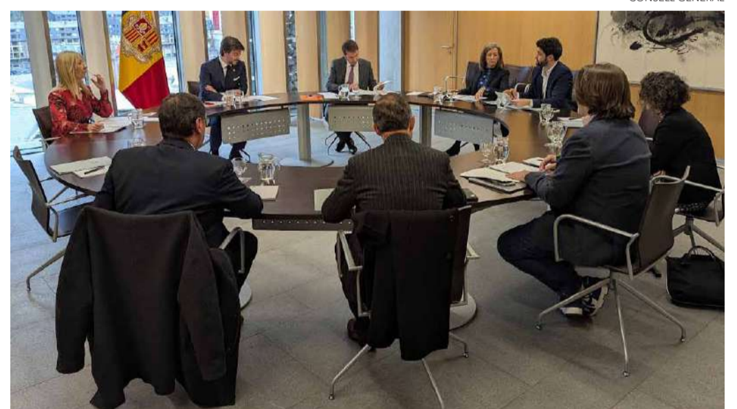
Els informes detallaran el posicionament de cada grup en les esmenes als textos legislatius.

D'altra banda, la Junta ha decidit modificar l'horari de les sessions del Consell General, les quals, a partir del 24 d'abril, se celebraran al matí, a les 09.30 hores. Tal com ha explicat Codina, el canvi respon a qüestions de conciliació familiar i a motius organitzatius, ja que «els serveis de Casa de la Vall ja no estan disponibles a partir de les cinc de la tarda», fet que podria generar dificultats logístiques en cas de necessitar suport administratiu. Aquest canvi ha comptat amb el consens de tots els grups parlamentaris.