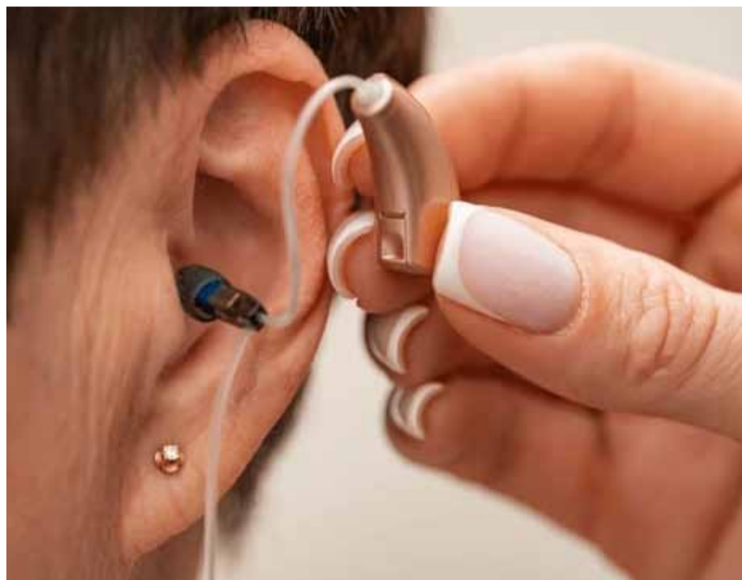
A professional fitting a behind-the-ear hearing aid to a client.

It is also interesting to know that only 4 out of 10 people with hearing impairment use hearing aids, which is equivalent to 39% of those involved. All of this is data provided in the aforementioned year and on a general scale by the National Association of Hearing Aid Practitioners of Spain. However, in our territory, certain advances were also made in the matter a few years ago with the appearance, for example, of the Association of Visual and Auditory Disabilities (2020) or as the recent demand