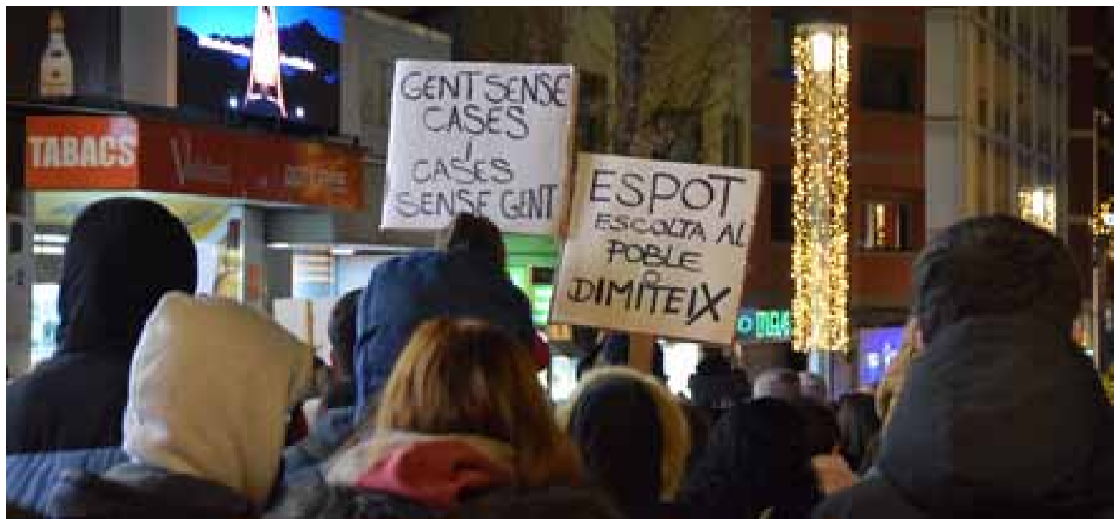
Una mobilització organitzada per la Coordinadora per un Habitatge Digne durant una campanya de Nadal.

És la quantitat dels enquestats que es veuen disposats a mobilitzar-se més vegades pel bé comunitari.