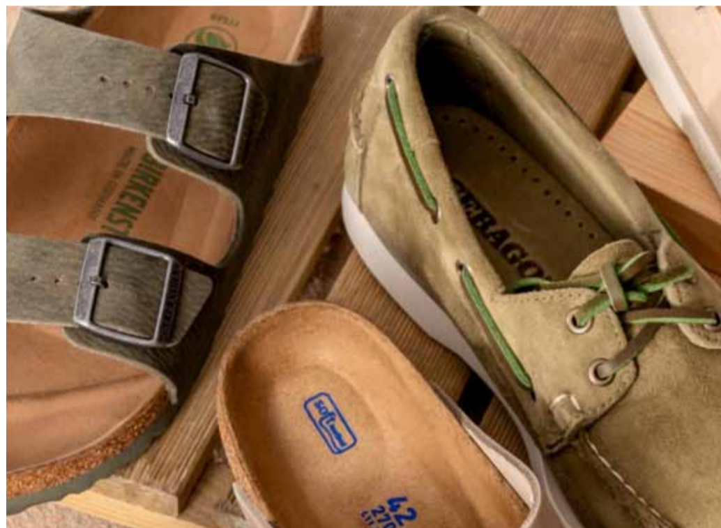
El grup de vestit i calçat ha contribuït a la reducció de la inflació.

De manera que segons publica aquest dimarts el Departament d'Estadística, aquest comportament de la inflació seria a causa, principalment, de la disminució dels preus en els grups de transports, habitatge, aigua, gas, electricitat i altres combustibles, així com del grup de vestit i calçat. Pel que fa als països de l'entorn, l'IPC avançat d'Espanya al febrer se situa en el 3%. En cas de confirmar-se, augmentaria una dècima respecte de la