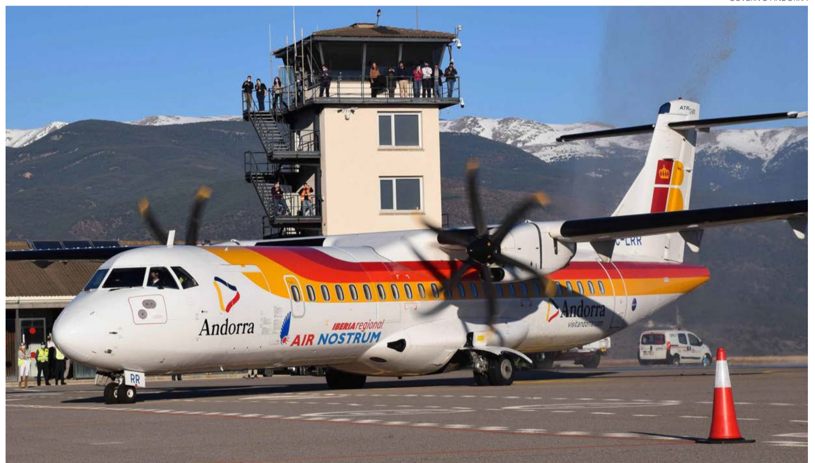
Tot i les 10 cancel·lacions i els 16 desviaments, Forné apunta a una millora respecte a l'any 2023.

Malgrat aquestes incidències, les dades reflecteixen una millora respecte al 2023, quan es va cancel·lar el 5% de les operacions, es va desviar el 10% i un 5% més van patir altres disruptcions. Forné ha subratllat que «el 2024 ha estat un any atípic en termes meteorològics, segons l'AEMET i