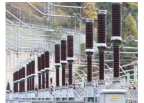
Increment del consum d'energia.