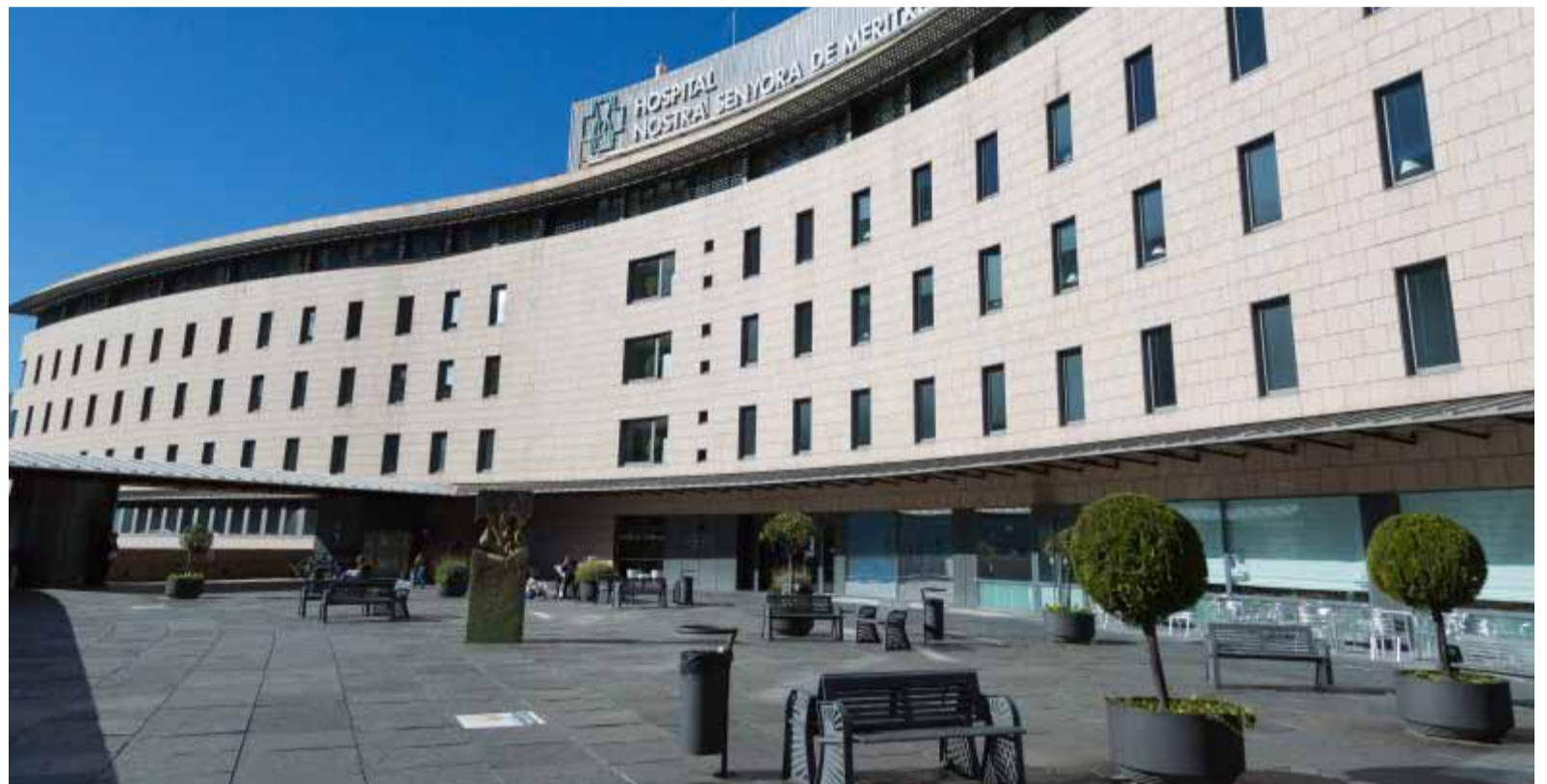
La façana principal i el pati de l'Hospital Nostra Senyora de Meritxell.