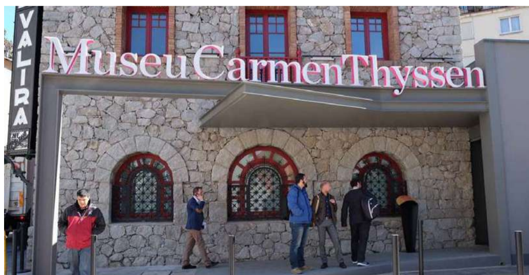
El museu Carmen Thyssen Andorra.

Els museus i monuments d'Andorra van rebre un total de 168.876 visitants durant el 2023, fet que suposa un increment del 17,1% respecte a l'any anterior, segons les dades publicades aquest matí pel Departament d'Estadística. Els museus del país van registrar 94.576 visitants, un augment del 7,6%. En aquest àmbit, els museus de titularitat nacional van atraure 44.354 persones, un 16,3% més que el 2022, mentre que els museus comu-