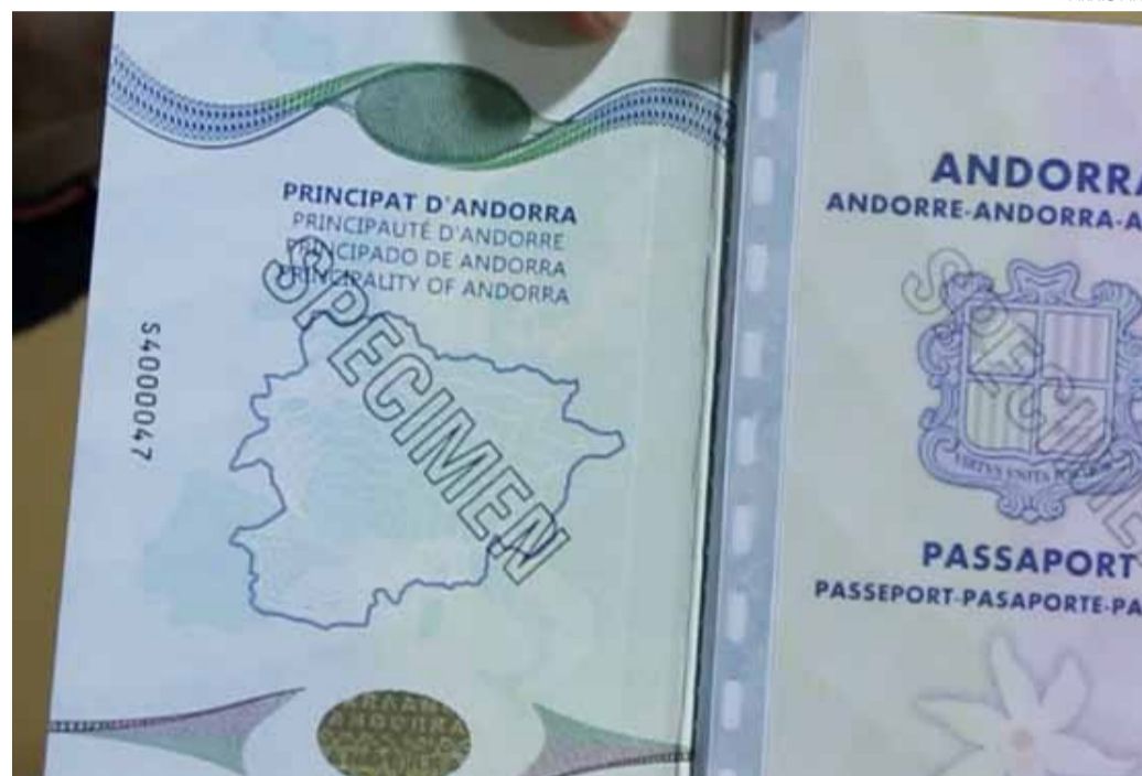
Tindrà un cost d'entre 10 i 16 lliures esterlines i permetrà múltiples entrades durant dos anys.

L'ETA és un permís electrònic necessari per a viatgers que es desplacin al Regne Unit per motius de turisme, negocis o es-