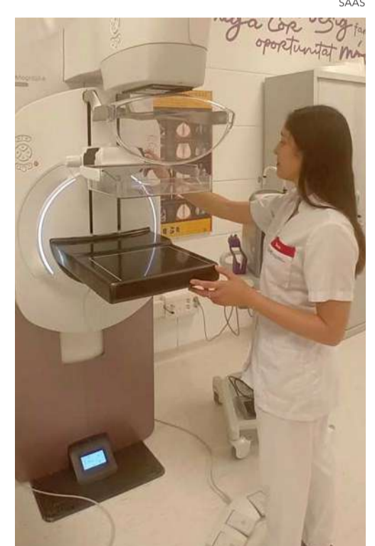
El nou equip de mamografia.

ons, la mida, la ubicació i l'extensió de la tumoració gràcies a la seva alta resolució que pot detectar un 53% més de casos de càncer de mama que no són visibles amb la mamografia tradicional, incloent-hi aquells tumors més petits i localitzats. Es tracta així d'una prova indolora que no estreny la mama i en la qual la pacient està exposada a menys radiació. ●