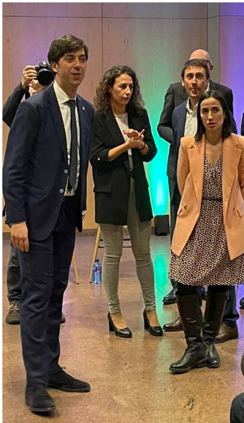
Instants previs a la reunió de poble celebrada a Andorra la Vella aquest dimecres a la nit.

Altrament, durant la sessió diversos ciutadans han aprofitat per plantejar preguntes i preocupacions. Un dels temes recurrents ha estat la neteja i manteniment de la via pública. «Els carrers de Príncep Benlloch estan en un estat deplorable», ha denunciat un veí, demanant una actuació immediata. Altres intervencions han versat sobre la remodelació del carrer Gil Torres, la millora del transport públic i la necessitat d'augmentar les zones verdes a la parròquia. «Estem estudiant diferents opcions per destinar una part del carrer Gil Torres a una zona verda per a la gent gran», ha avançat la corporació comunal. ●