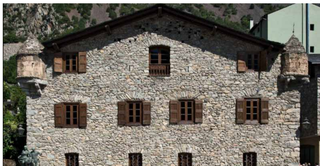
La façana que exhibeix un dels indrets més icònics del patrimoni andorrà, la Casa de la Vall.

El Consell de Ministres ha aprovat, a proposta de la ministra de Cultura, Joventut i Esports, Mònica Bonell, el Decret de definició de l'entorn de protecció de la Casa de la Vall i de l'església de Sant Esteve, a la parròquia d'Andorra la Vella, així com els criteris que han de regir les intervencions sobre els monuments i el seu entorn. En