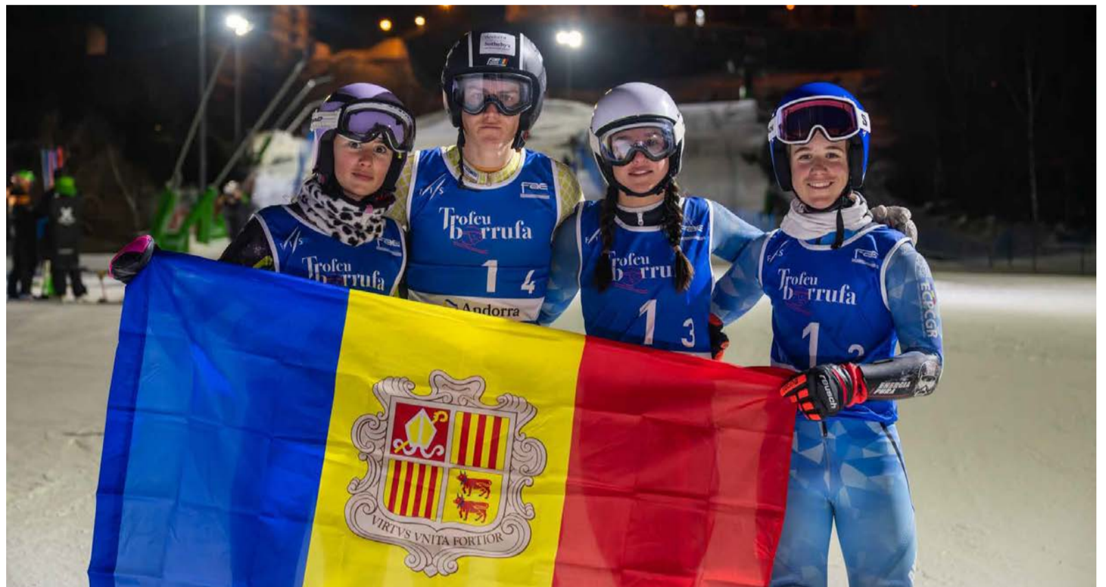
L'equip andorrà vencedor del National Team Event del Trofeu Borrufa.