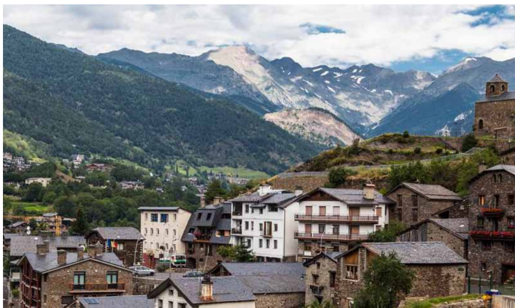
Una imatge general de la Massana.