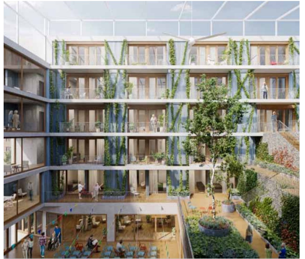
El projecte preveu la construcció d'una cinquantena de pisos de 50 metres quadrats.