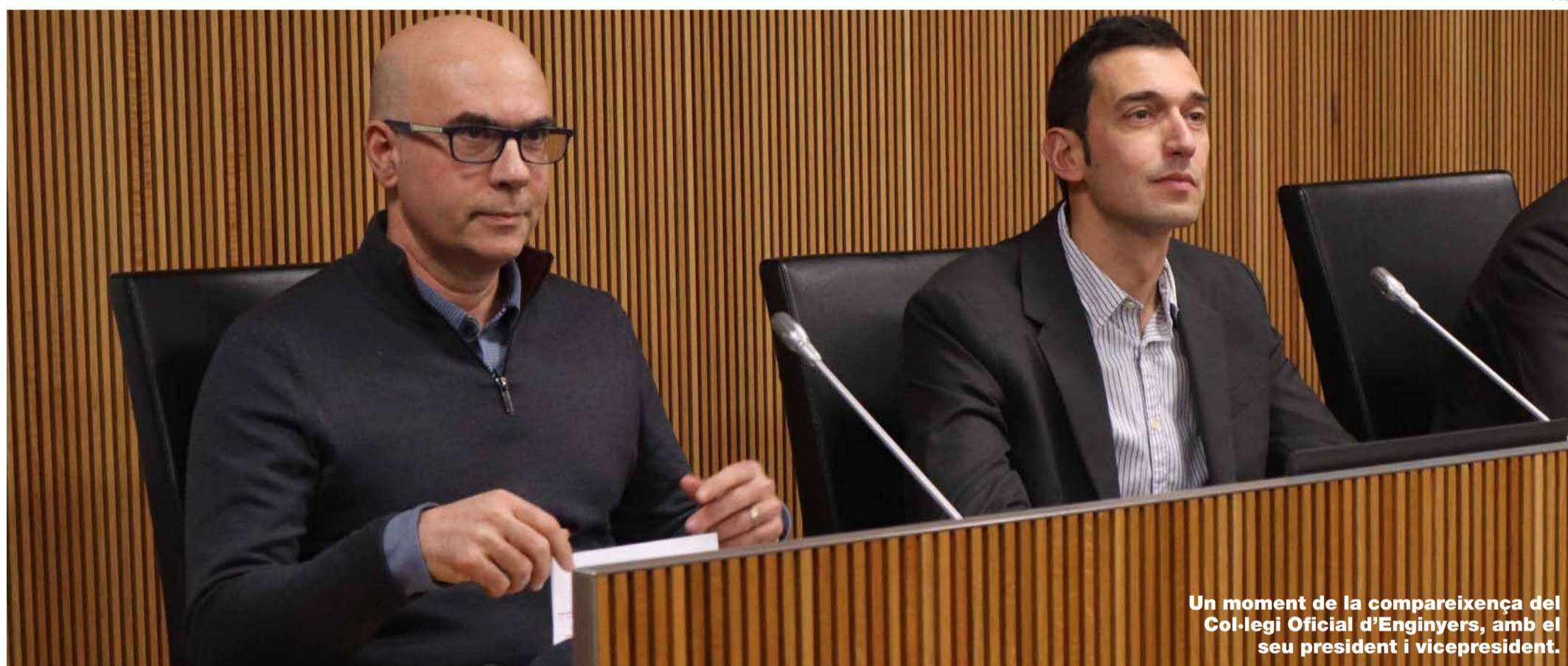
Un moment de la compareixença del Col·legi Oficial d'Enginyers, amb el seu president i vicepresident.

Els enginyers i els contractistes reclamen seguretat en termes de sòl i els residus per una expansió responsable