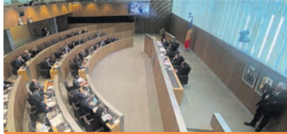
9.30 Sessió de Consell General