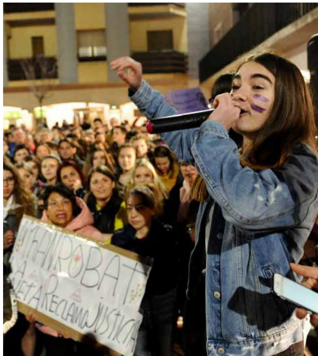
Una noia intervé durant la manifestació feminista pel 8M l'any 2023.

Una de les principals reclamacions de Stop Violències és la creació d'un jutjat especialitzat en violències sexuals al Principat. Segons Mendoza, a l'hospital «no hi ha un equip multidisciplinari per atendre les violències d'acord amb el Codi Lila», i ha denunciat que institucions clau, com la Policia, «no disposen d'equips especialitzats en violències». Altrament, ha destacat la importància d'una bona educació sexual, tot assegurant que «actualment no estem oferint una formació adequada; no es tracta només d'ensenyar a posar un preservatiu, sinó tam-