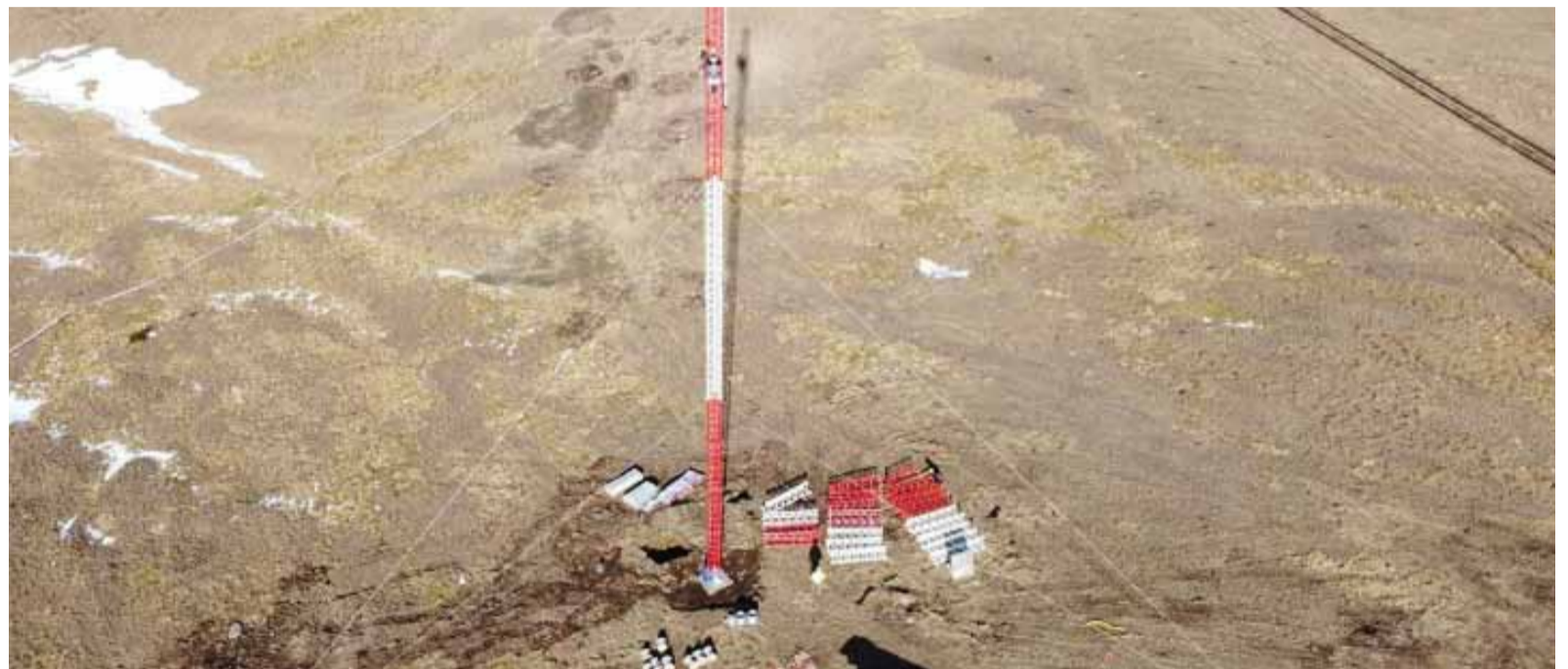
La zona del Maià on es construirà el parc eòlic.

Amb aquest tràmit, es reserva l'espai necessari en l'àmbit urbanístic per impulsar el parc eòlic del Maià. Paral·lelament, s'ha d'iniciar la cessió gratuïta dels terrenys comunals d'Encamp i Canillo on s'ubicarà la infraestructura, un pas fonamental perquè es pugui materialitzar el projecte. Segons el ministre portaveu, Guillem Casal, la previsió és que el parc estigui en funcionament el 2027. Tot i això, ha reco-