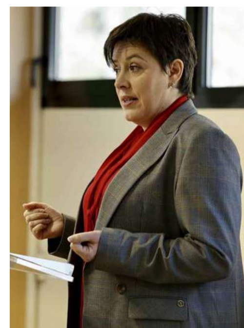
Mingorance will serve a nine-year term.

Your leading real estate agency in Andorra.