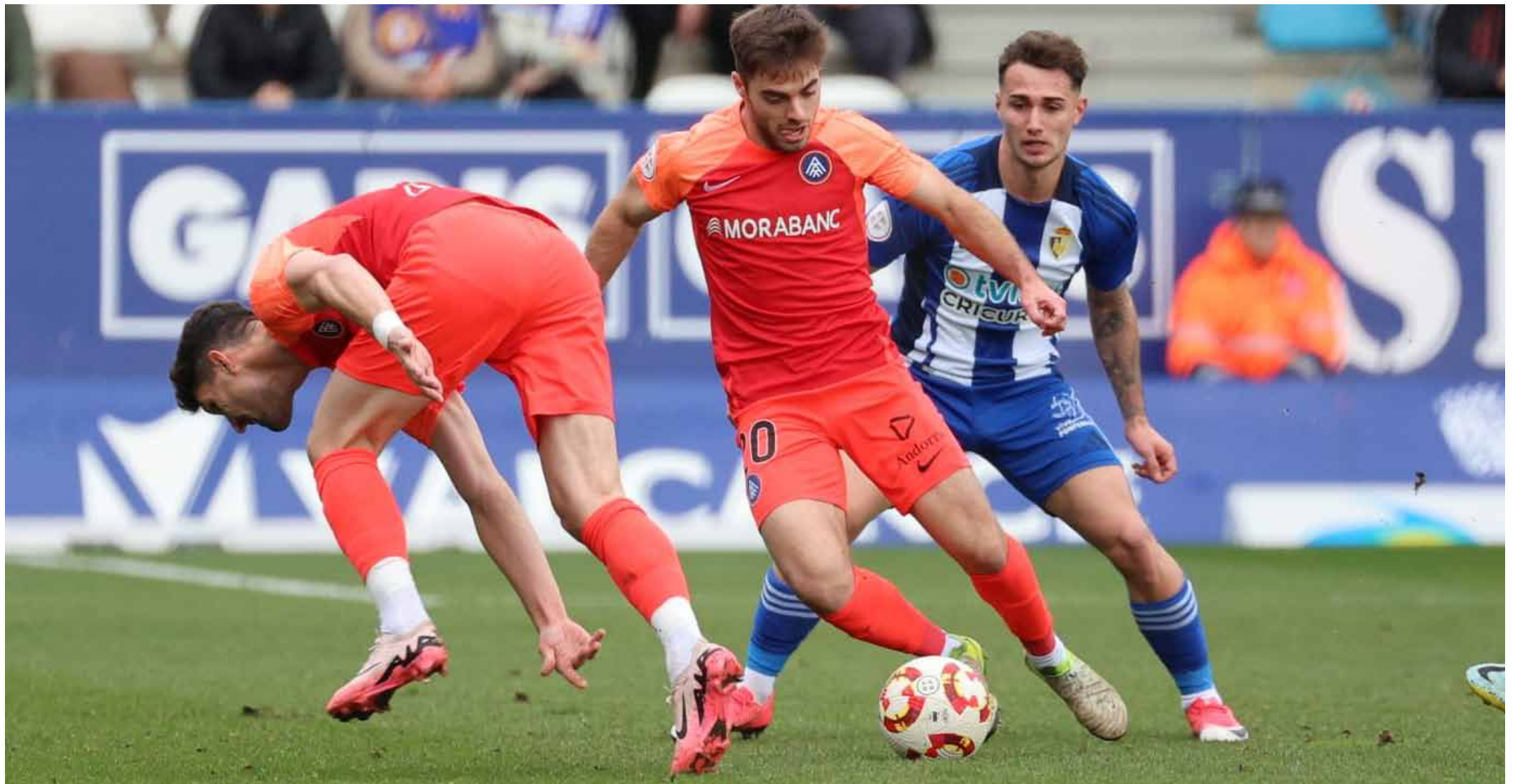
Un instant del partit.