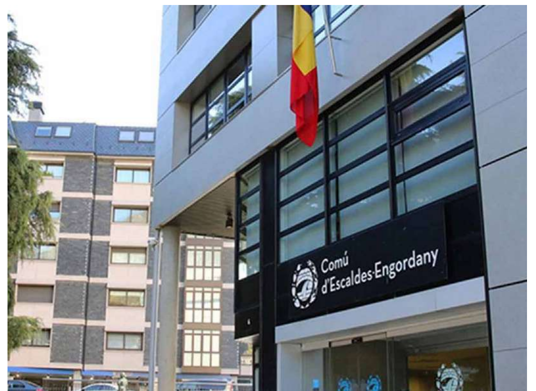
El comú d'Escaldes-Engordany.

Pel que fa al pressupost total destinada a aquestes ajudes, aquest ha estat de 50.727 euros, distribuït en diverses partides econòmiques. Les més significatives són les assignades a Escola Bressol, amb 10.338 euros, Alimen-