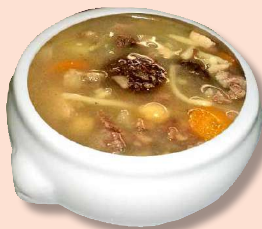
Escudella de la iaia