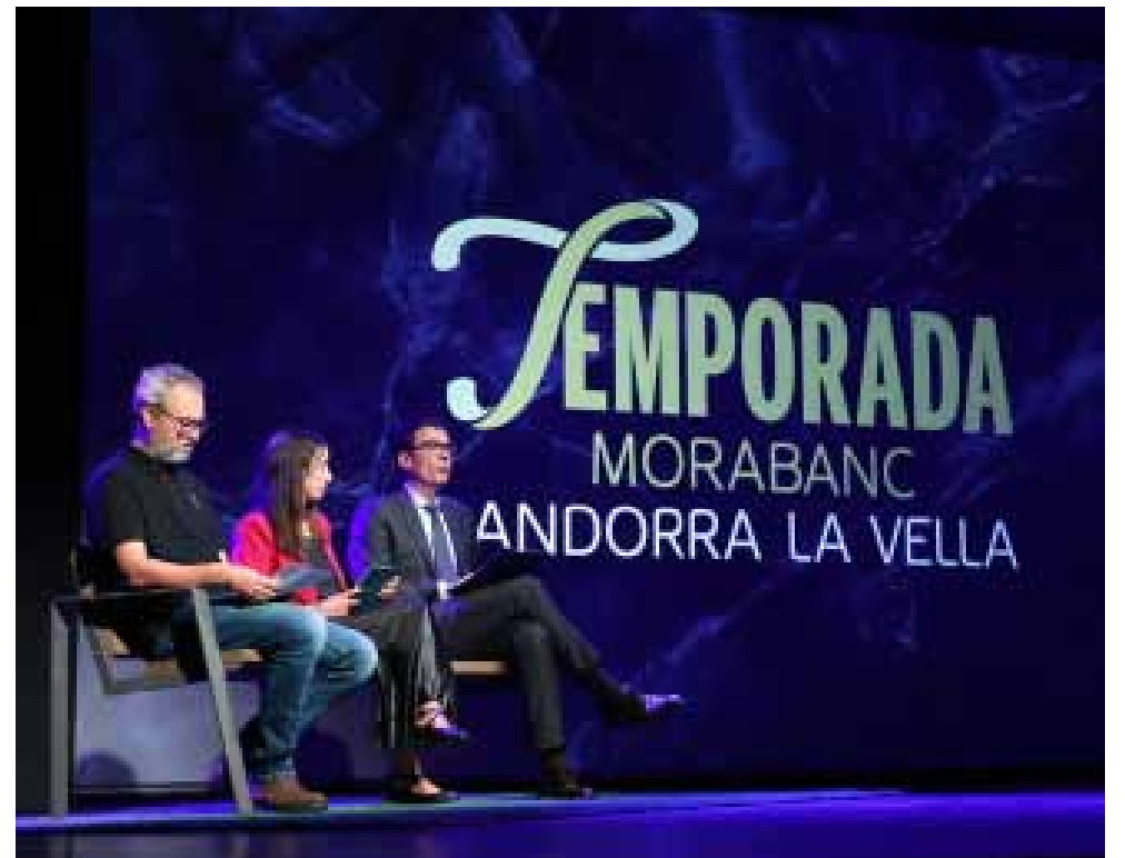
Durant la presentació del festival Temporada MoraBanc.