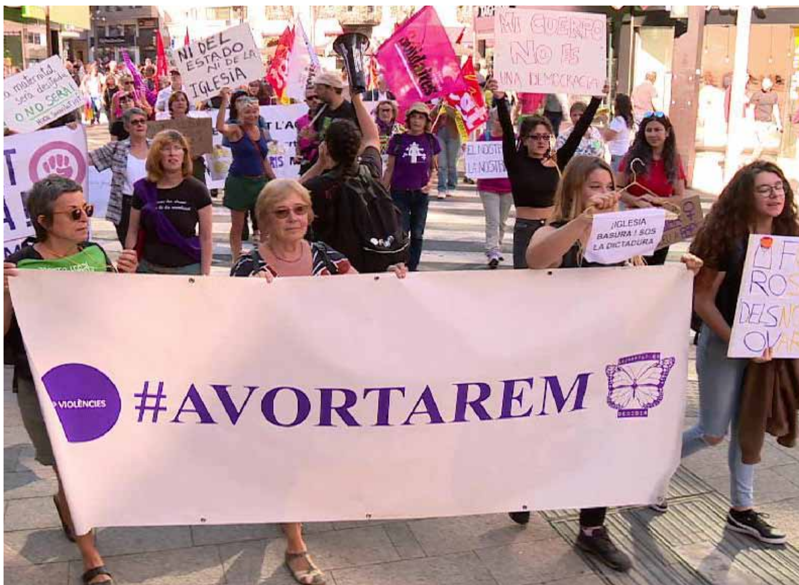
Stop Violències afirma que el programa és trans inclusiu.