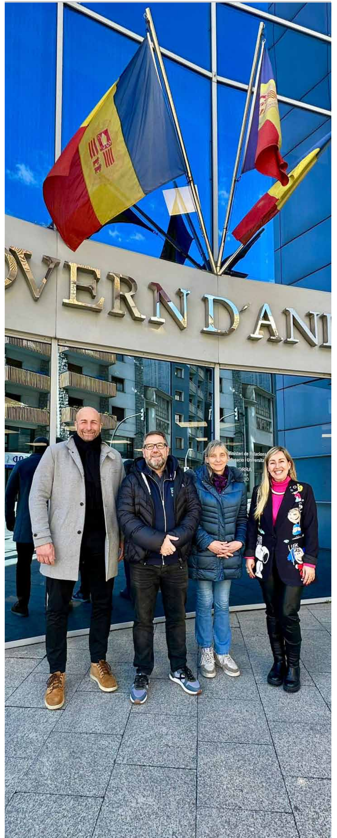
Una imatge de la trobada.

Educació del Govern d'Andorra i el Centre d'Estudis de les Dones d'Europa han qualificat la trobada de pròspera i fructífera.●