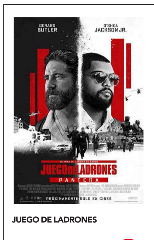
JUEGO DE LADRONES