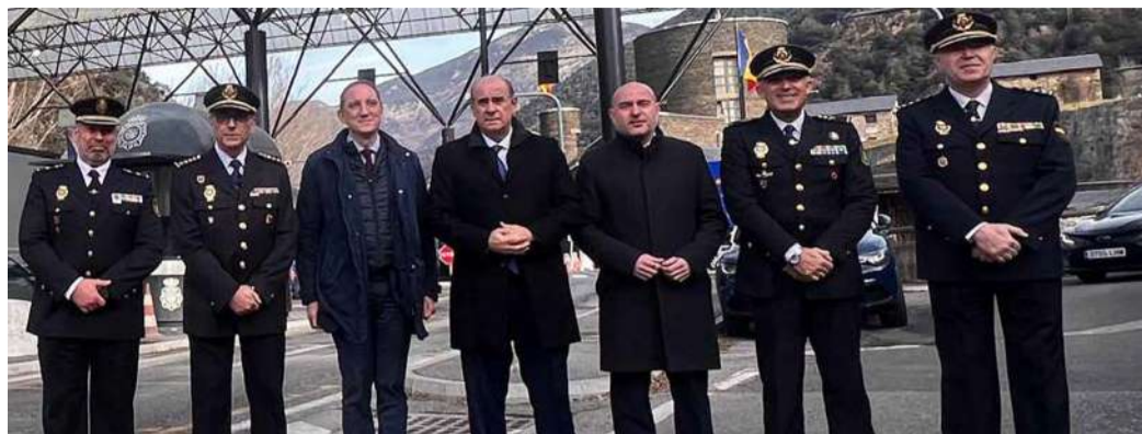
El director general de la policia espanyola, Francisco Pardo Piqueras, avui a la celebració.

SUBDELEGACIÓN DEL GOBIERNO DE ESPAÑA DE LLEIDA