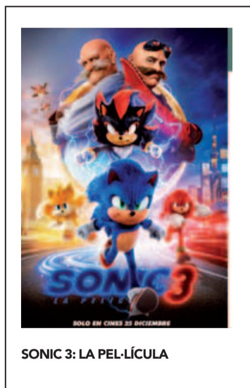
SONIC 3: LA PEL·LÍCULA