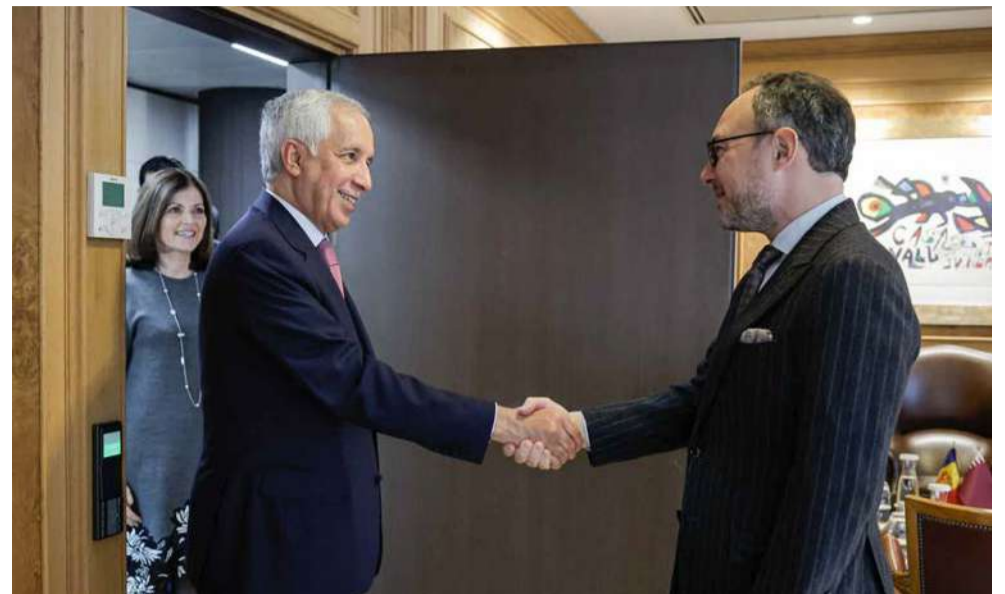
El cap de Govern, Xavier Espot, i el ministre d'Estat d'Afers Exteriors de Qatar, el sultà bin Saad Al Muraikhi.