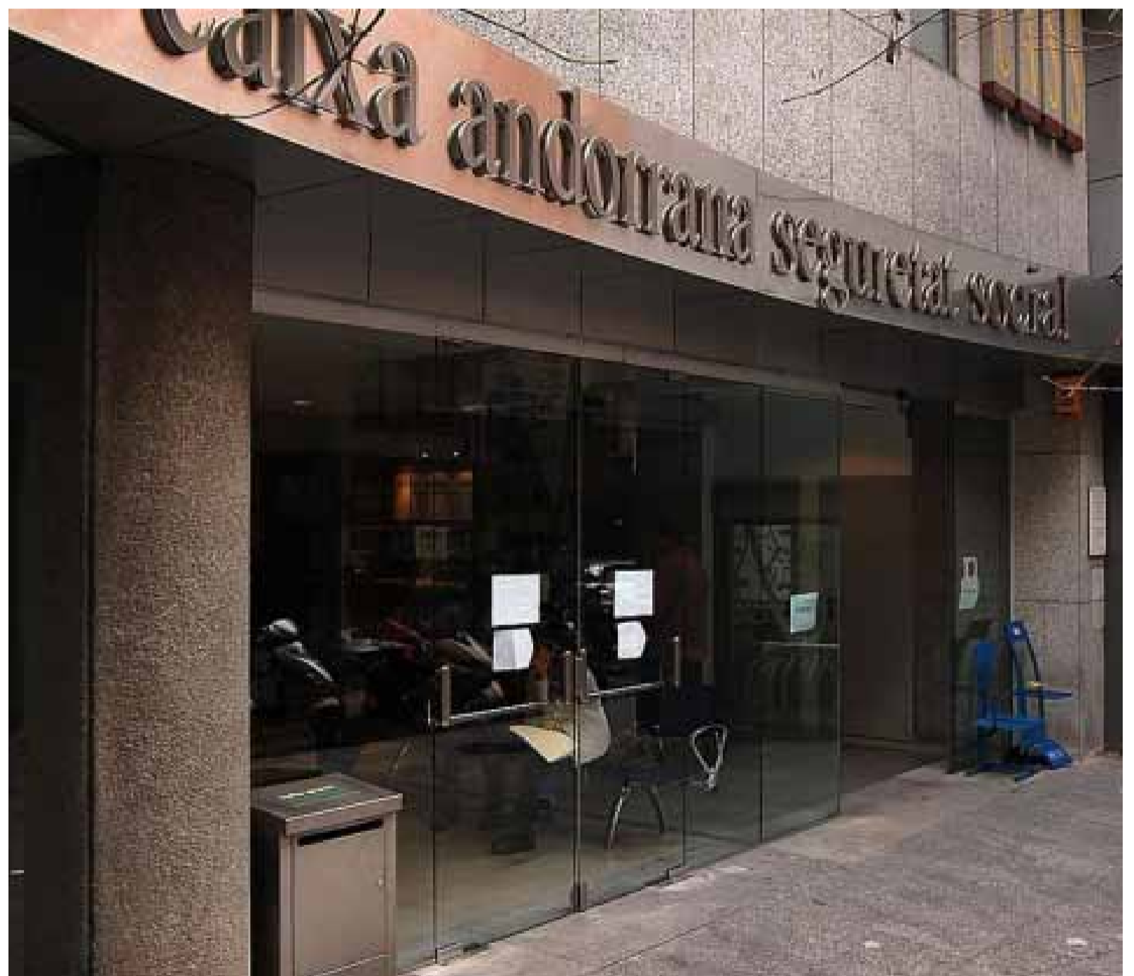
El FRJ també destaca que s'ha assolit «àmpliament» l'objectiu de superar la inflació andorrana a llarg termini.

El FRJ també destaca que, a més, s'ha assolit «àmpliament» l'objectiu de superar la