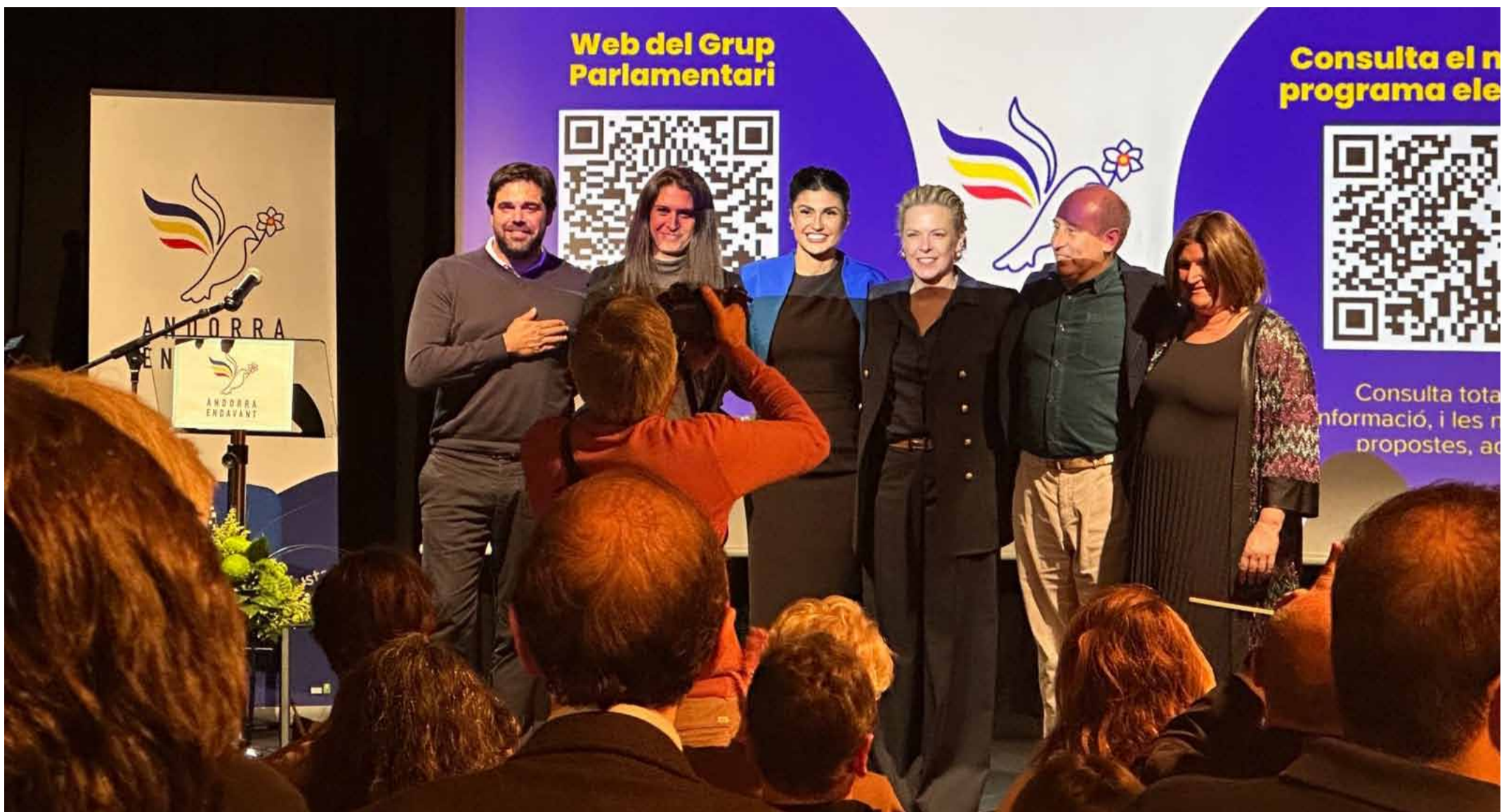
La nova directiva del partit Andorra Endavant, en l'acte de presentació celebrat el passat dilluns.