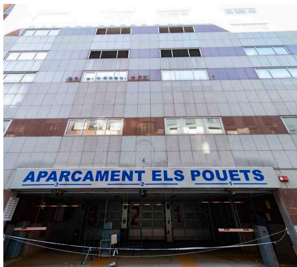
El Comú d'Andorra la Vella vol donar-li un ús a l'edifici dels Pouets.