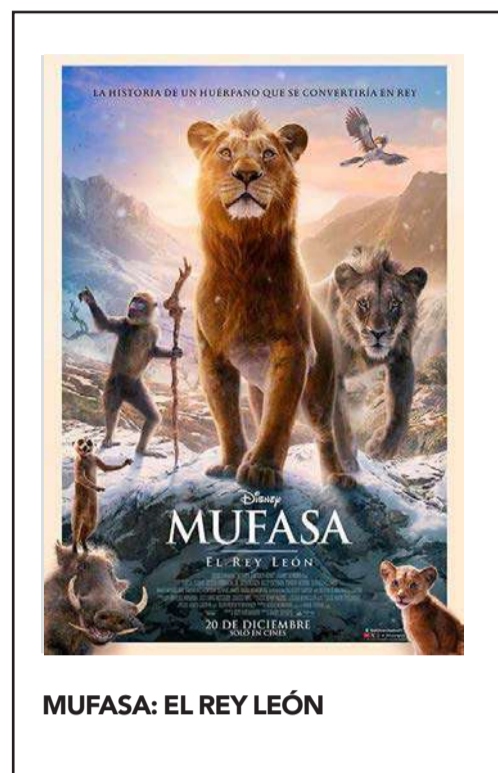
MUFASA: EL REY LEÓN