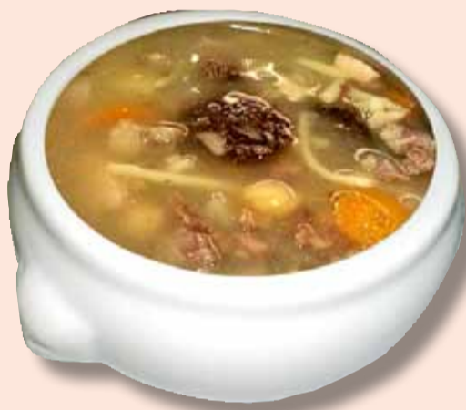
Escudella de la iaia