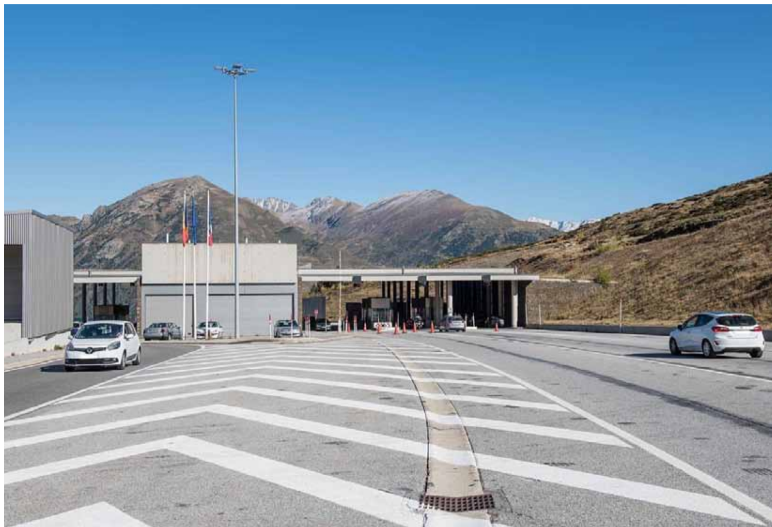
A picture of the state of the road in Pas de la Casa.