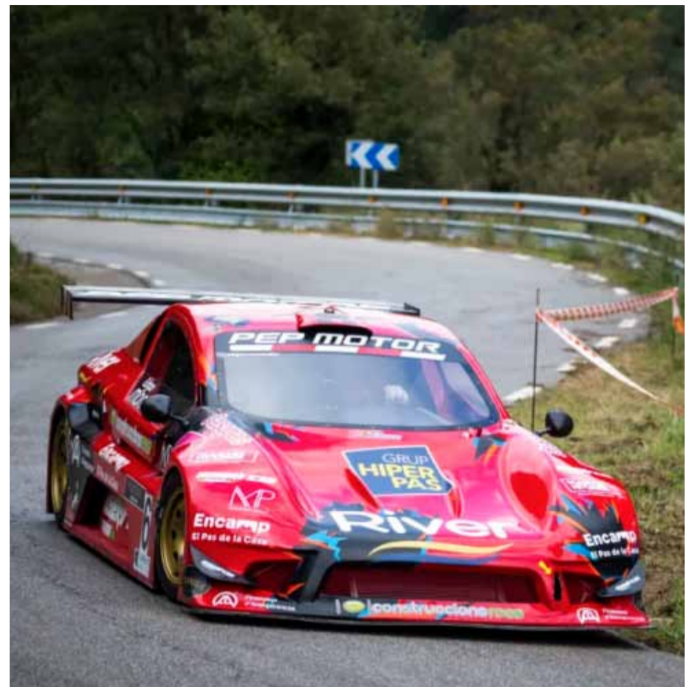
El pilot andorrà Edgar Montellà.