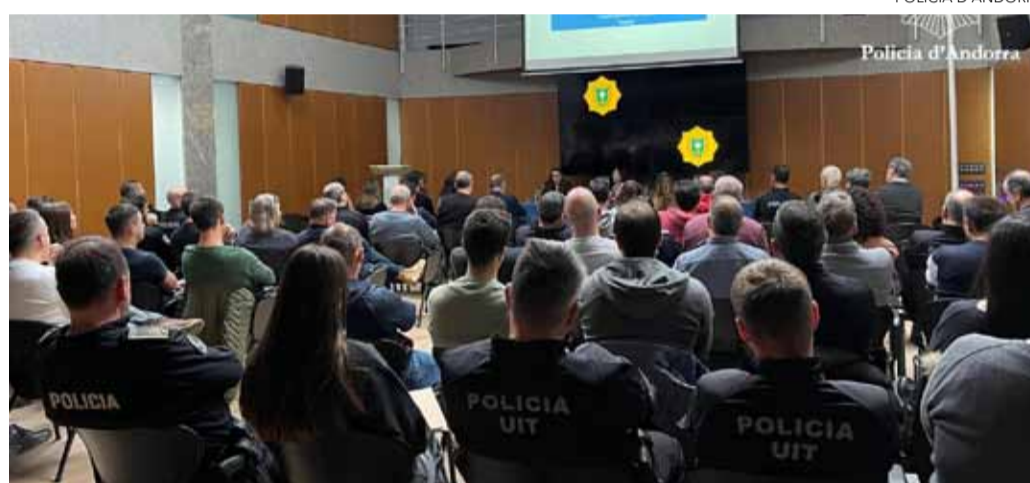
A snapshot from the conference held last Monday.

During her speech, Peramato stressed that «only 21.5% of cases of gender-based violence are reported, and this black figure demonstrates the seriousness of the problem.» The prosecutor explained that factors such as economic dependence, fear of losing children or the normalization of violence prevent many victims from taking the step. «If there is no report, there is impunity, and this place the