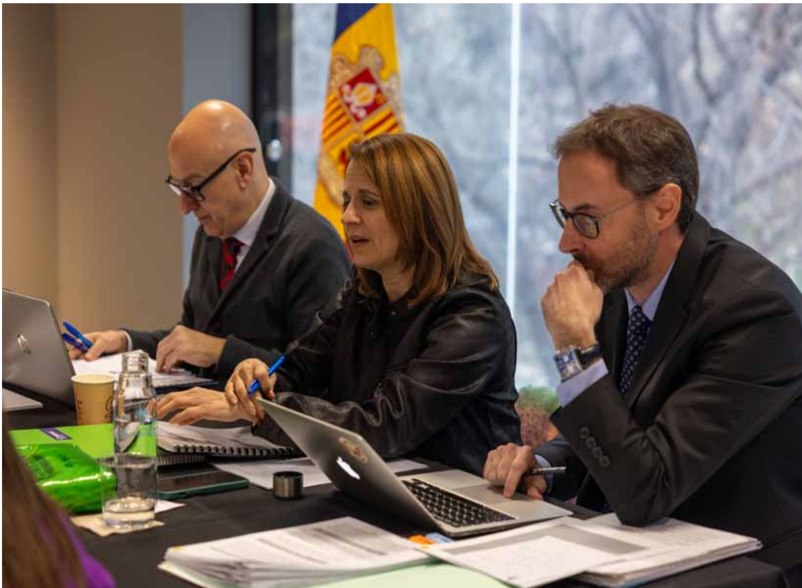
La reunió de cònsols tingut lloc ahir a l'Espai Caldes i traslladada pels cònsols de Canillo i Escaldes-Engordany.