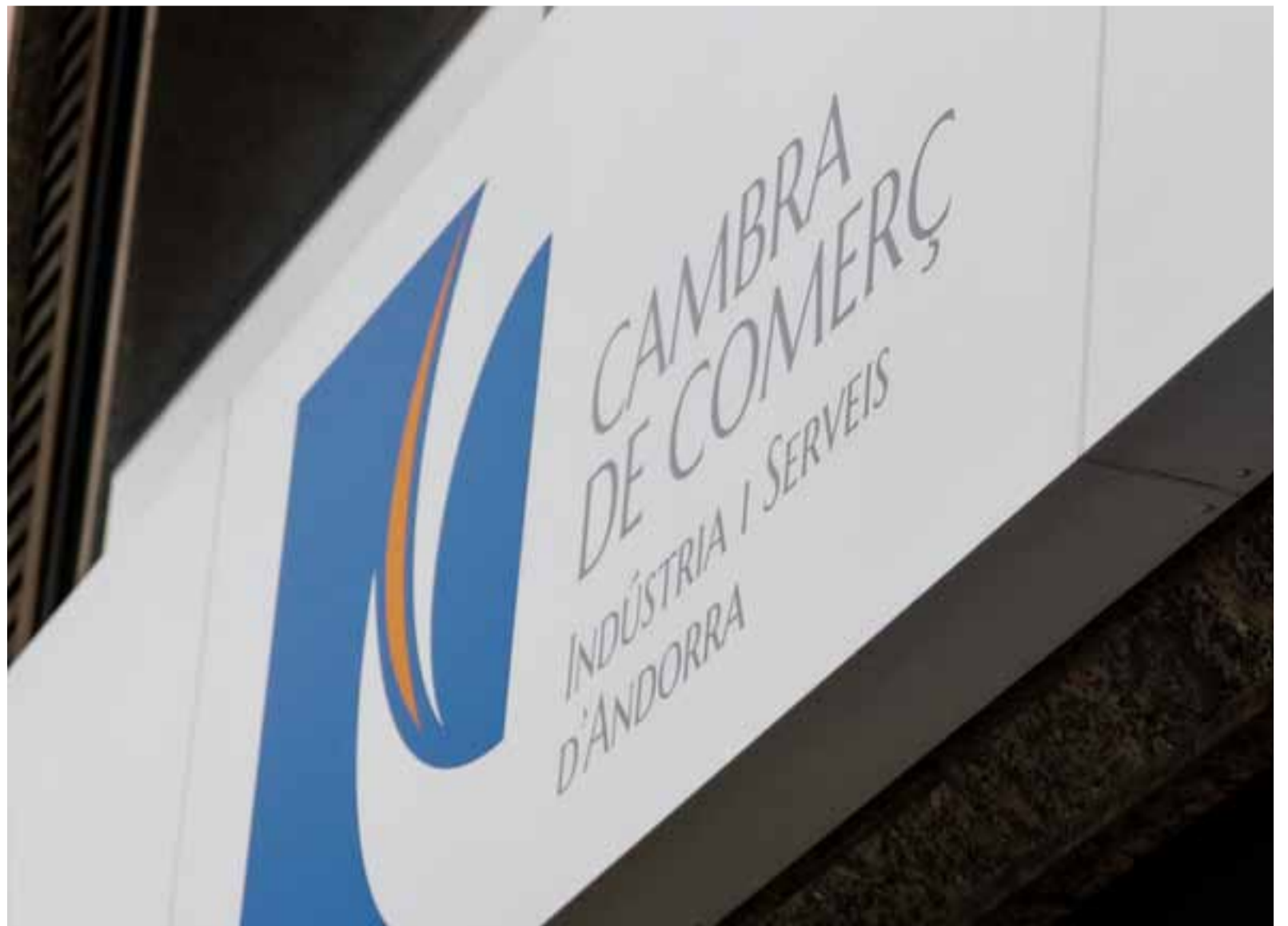
La seu de la Cambra de Comerç, Indústria i Serveis ubicada al centre d'Andorra la Vella.

Quant a sectors, la construcció ha continuat liderant el creixement durant la primera meitat de l'any 2024, tot i l'ajust significatiu del mercat immobiliari i l'augment dels costos financers. Els serveis, d'igual forma, han continuat amb un impuls notable i han contribuït de forma destacada a l'estímul de l'activitat econòmica. Dins el sector terciari, sobresurt el dinamisme de les activitats financeres, professionals, tecnològiques i tècniques, així com les relacionades amb l'educació i la sanitat. Altrament, els serveis vinculats a l'hoteleria i al turisme han continuat experimentant una demanda molt elevada, encara que, com era d'esperar, el ritme s'ha moderat en comparació amb els forts augments del 2023.