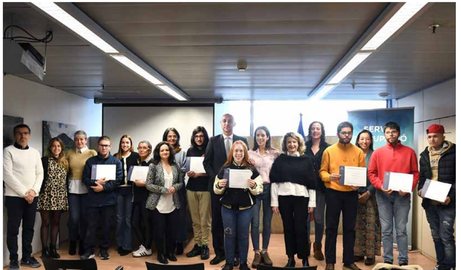
Els joves i les empreses participants en el programa Activa't 2024.

Aquest dimarts es va celebrar l'acte de lliurament de diplomes, una cerimònia que reconeix l'esforç d'aquests joves i la col·laboració de les empreses. «Fins ara, 30 joves han passat per aquest programa. És un balanç positiu que reflecteix el compromís del Govern amb les polítiques actives d'ocupació», va destacar amb orgull el secretari d'Estat d'Economia, Treball i Habitatge, Jordi Puy. A més, va expressar la voluntat d'ampliar la