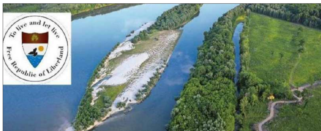
Mapa geogràfic actual del territori independent de Liberland.