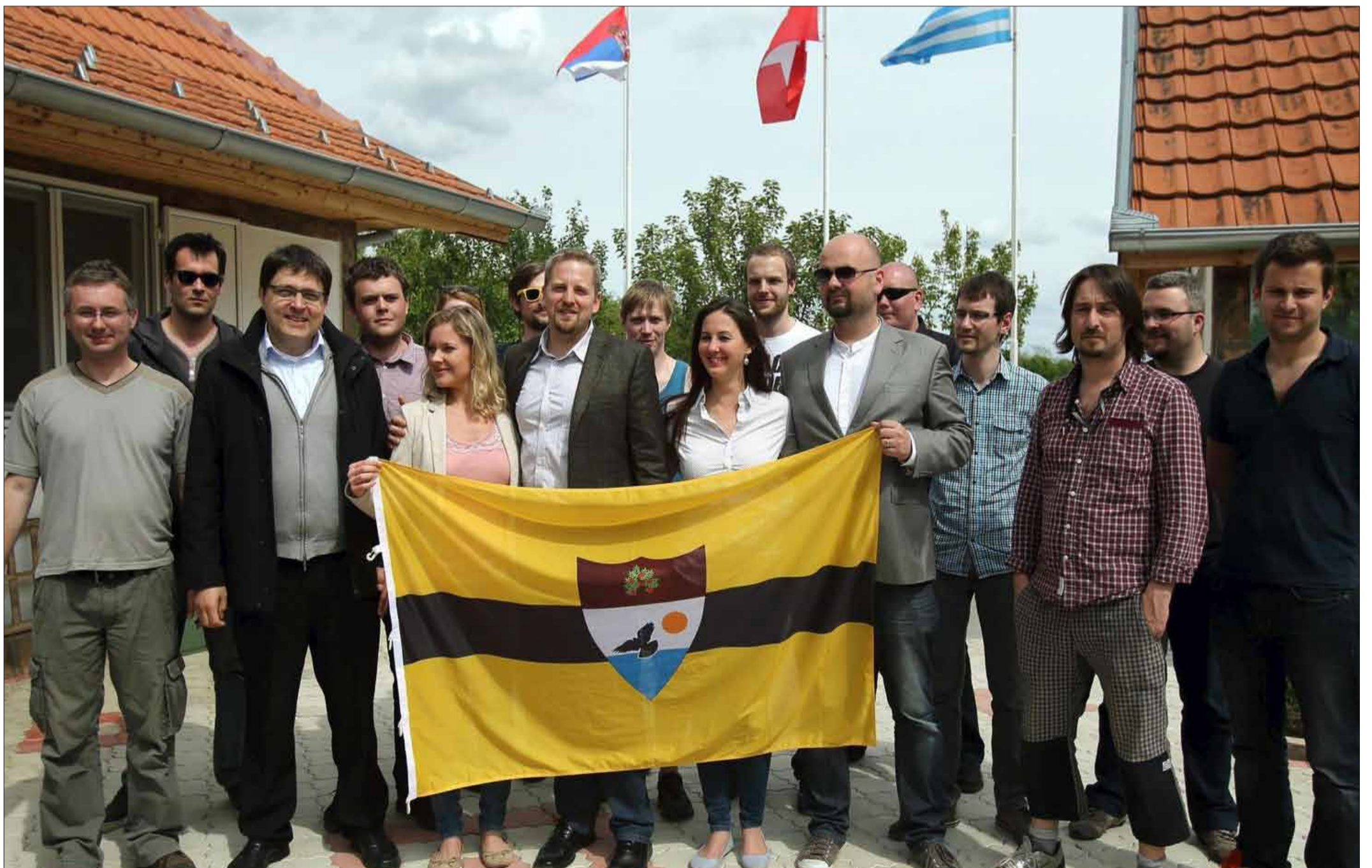
Foto de 'família' de Vit Jedlicka amb alguns dels seus votants i la bandera del territori de Liberland.