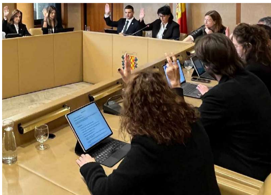
The Municipality of La Massana is working on a strategy to rectify the situation and boost Pal and Arinsal for the next season.