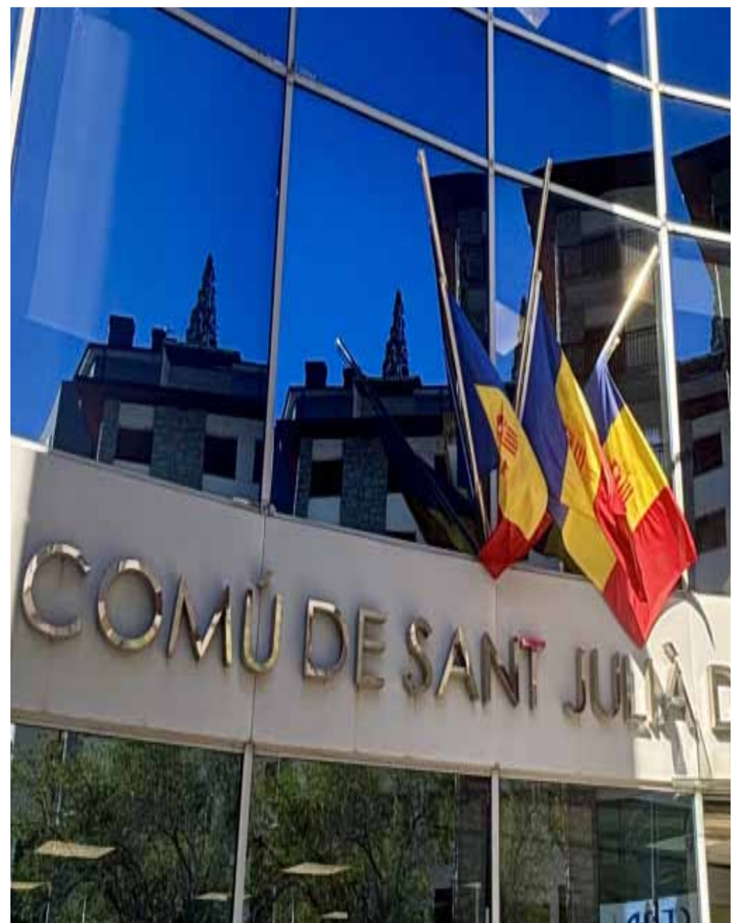
The Municipality of Sant Julià decreed this Monday a day of municipal mourning.

The case began on Sunday, when the mother of the minor was arrested in the municipality of Coll de Nargó, in Alt Urgell, where the Mossos d'Esqua-