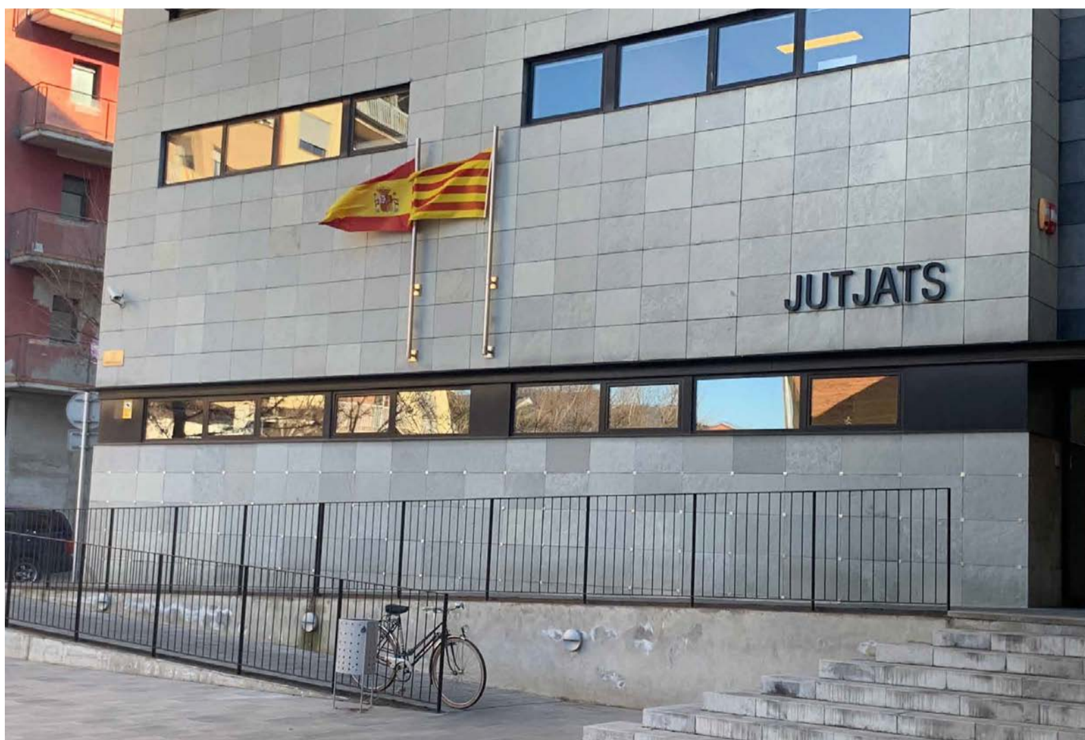
Els jutjats de la Seu d'Urgell, on va declarar ahir l'acusada pel succeït.