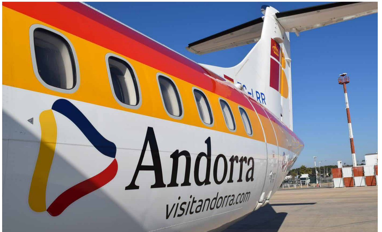
Un avió estacionat de dia a l'aeroport d'Andorra-la Seu d'Urgell.

La Generalitat, com a propietària de la instal·lació, continuarà amb la gestió diària de l'aeroport a través d'Aeroports de Catalunya, mentre que, per la seva part, l'Executiu aportarà anualment el 50% del dèficit d'exploració, amb un límit màxim de 400.000 euros. La renovació formal del conveni serà signada pròximament pel secretari d'Estat de Transició Energètica, Transports i Mobilitat, David Forné, i la consellera de Territori, Habi-