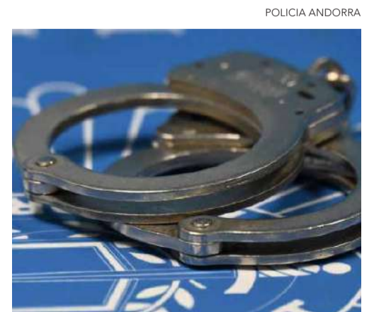
Imatge d'unes manilles de la Policia.

anys tenien com a objectiu obtenir els reemborsaments de la CASS i de les assegurances complementàries. A més, el perjudici causat pel mateix ascendeix a més de 5.000 euros, 9.700 euros i gairebé 3.300 euros respectivament. Una causa que ha portat a que les tres detingudes passessin a disposició judicial aquest matí dilluns a la tarda. ●