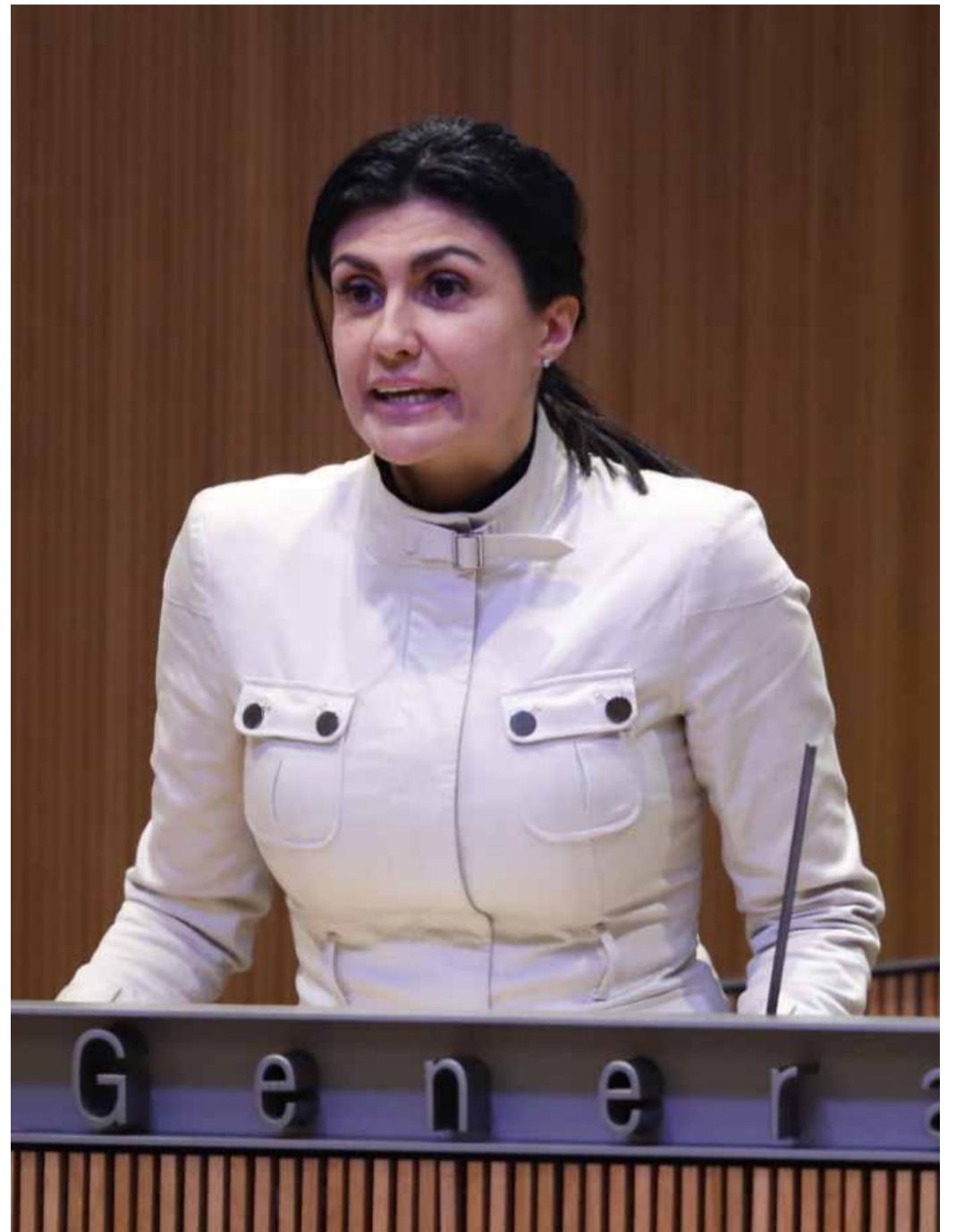
Una aliança global per promoure una salut pública lliure d'interessos privats.

Un dels moments més destacats d'aquesta relació va ser la cimera COVID a Estocolm, celebrada al desembre de 2020, on Montaner va ser convidada com a única ponent política. Aquesta cimera, que va reunir experts internacionals, premis Nobel i advocats, va oferir una plataforma per reflexionar sobre la resposta global a la pandèmia i per advocar per una revisió crítica de les polítiques sanitàries implementades durant la crisi. Aquest esdeveniment va consolidar la posició de Montaner