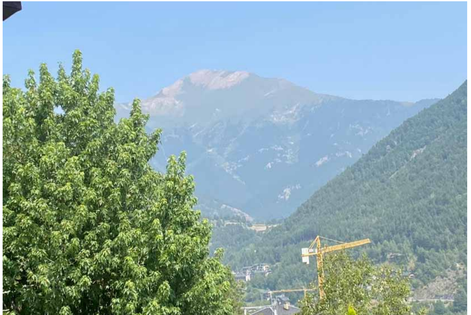
Vista del Casamanya enterbolit.

Tot i que aquesta temporada d'incendis forestals ha estat més moderada que la de l'any passat, quan les flames van consumir la xifra rècord de 17 milions d'hectàrees de terreny, Canadà ha arribat a afrontar aquest agost fins a 900 incendis forestals actius simultània-