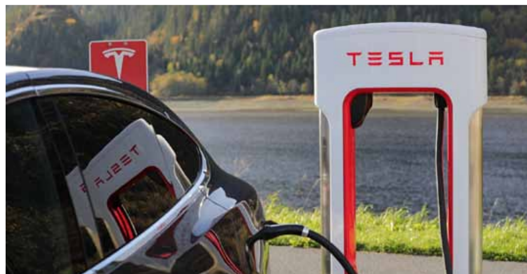
Cotxe elèctric recarregant.

La Comissió Europea ha anunciat aquest dimarts que fixarà un aranzel del 9% a Tesla per la producció dels seus cotxes a la Xina. Segons Brussel·les, les importacions d'aquest tipus de cotxes a la UE van augmentar des del 3,9% el 2020 fins al 25% registrat durant el període en què va dur a terme la investigació, i Brussel·les creu que aquest aranzel pro-