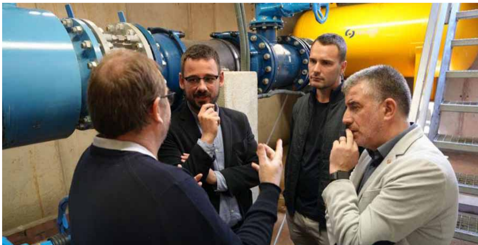
Alcaldes de Girona, Salt i Sarrià de Ter.