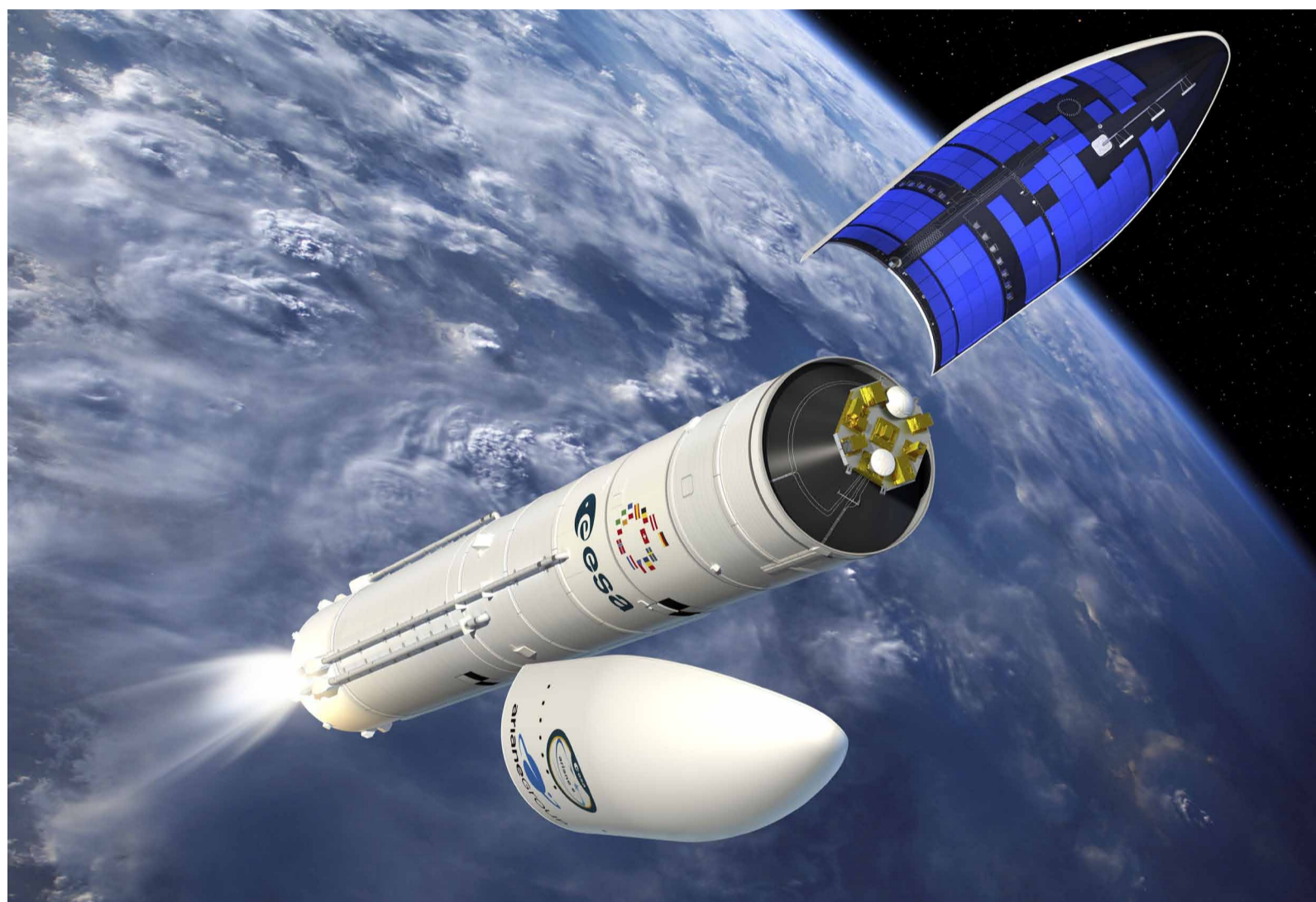
Imatge infogràfica de l'Ariane 6.

Des del llançament, les dades del lloc de llançament i les dades transmeses pel coet i les seves càrregues útils han estat analitzades per equips de l'ESA, ArianeGroup, CNES i Arianespace, iniciant l'anàlisi que ajudarà els equips a comprendre cada moment del llançament històric i garantir el rendiment dels vols futurs. Amb el llançament d'Ariane 6, Europa torna a l'espai amb la seva capacitat de llançament. Després d'una fase de «descens» de 35 minuts, és a dir, un període sense embranzida del motor principal Vinci, aquest ha tornat a posar-se en marxa per segona