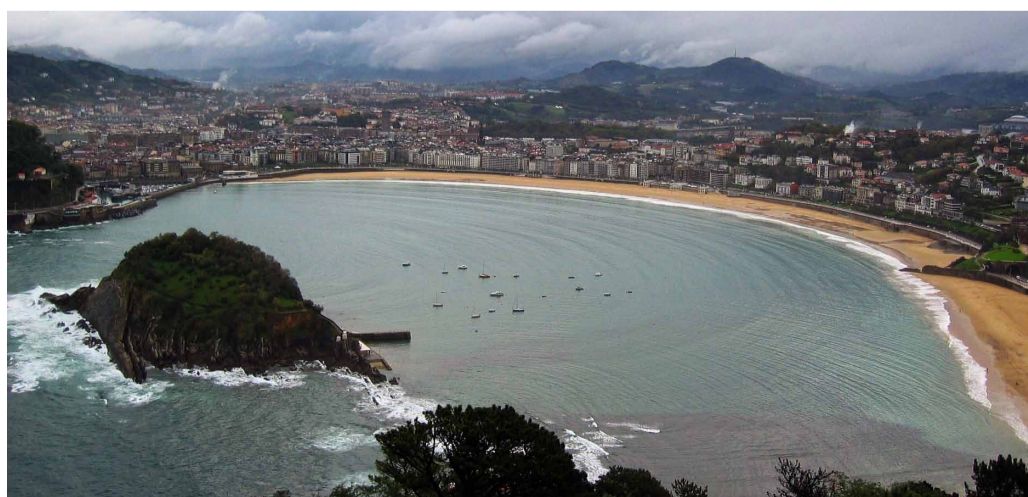
Platja de 'la Concha'.

interiors repartits per tota la ciutat. Els refugis exteriors són parcs, espais oberts o passejades on la presència d'arbrat fa que la temperatura baixi uns graus, i és una alternativa per als desplaçaments a peu. Es proposen itineraris amb més ombra si cal entre els exteriors, on hi ha les 300 hectàrees de parcs i zones verdes de Sant Sebastián, i l'ombra dels arbres fa més suportable la calor. Els interiors s'ubiquen a biblioteques, cases de cultura, museus, poliesportius, mercats i fins i tot esglésies repartides al llarg de la ciutat i amb bones condicions tèrmiques. ●