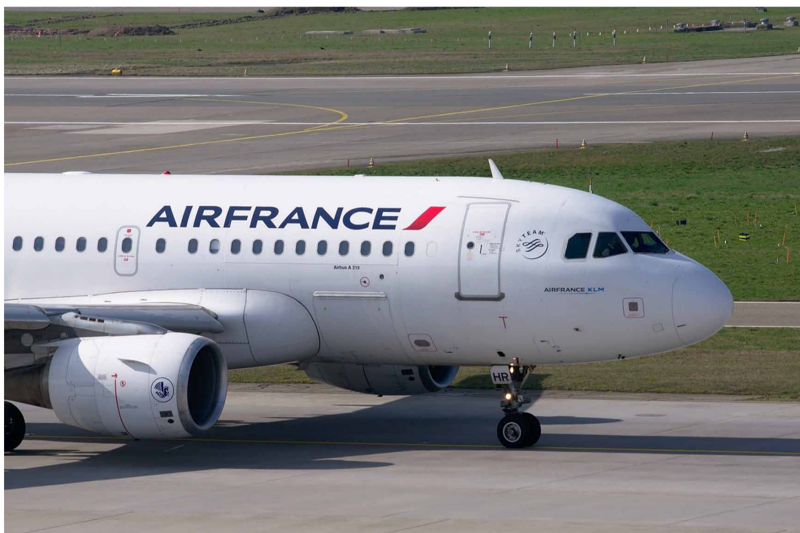
Avió d'Air France.

El 26 de juliol, data de la cerimònia d'obertura dels Jocs Olímpics, els aeroports de Roissy, Orly, Le Bourget i Beauvais simplement es paralizaran de 19.00 a 24.00 hores. El sobrevol de París i la regió parisenca estarà prohibit en un diàmetre de 150 km des de les 19.00 fins a mitjanit. ●