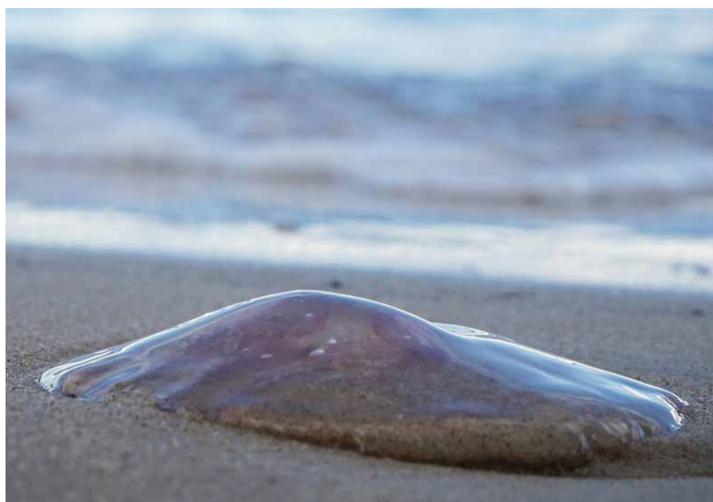
Meduses varades a la platja.

encara són urticants per un temps ▶▶ Informar el personal de platja perquè valorin la situació. ▶▶ Davant d'una trobada amb meduses a l'aigua, nedar pausadament i sortir de l'aigua sense moviments bruscs.