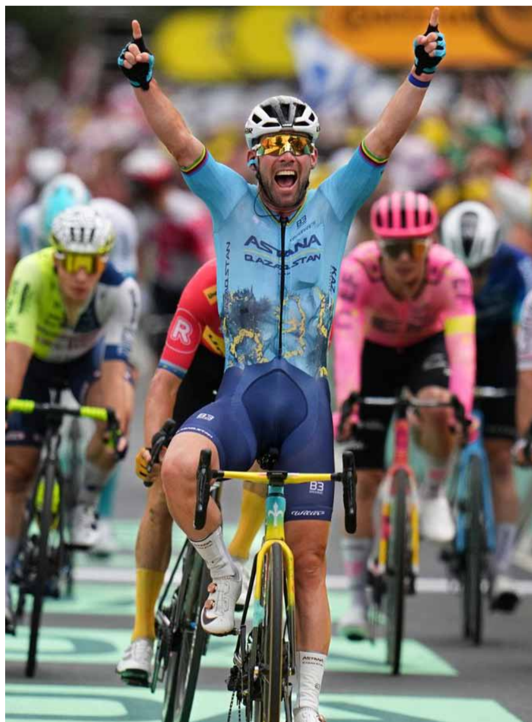
Victòria de Mark Cavendish.

El Tour de França d'aquest any consta d'un total de 21 etapes amb un recorregut de 3.492 quilòmetres repartits entre França, Itàlia, San Marino i Mònaco. ●