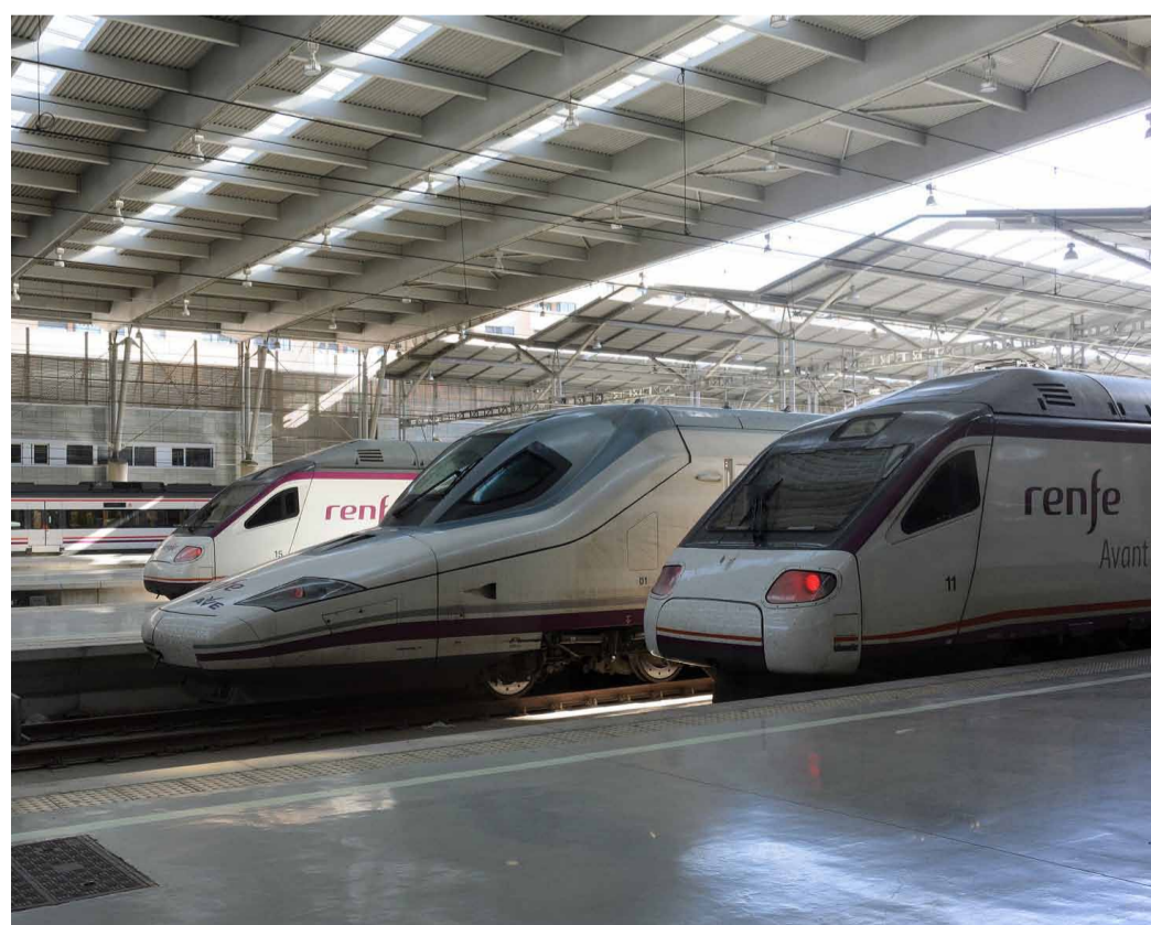
Trens de RENFE.