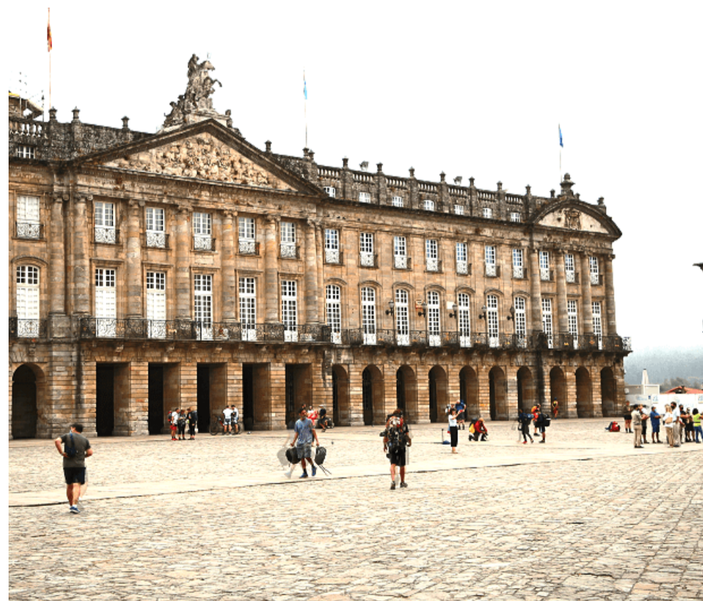
Plaça de l'Obradoiro, Santiago de Compostela.