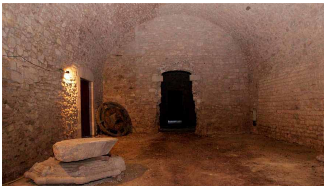
Els soterranis de la catedral que tornen enguany a ser un refugi climàtic.