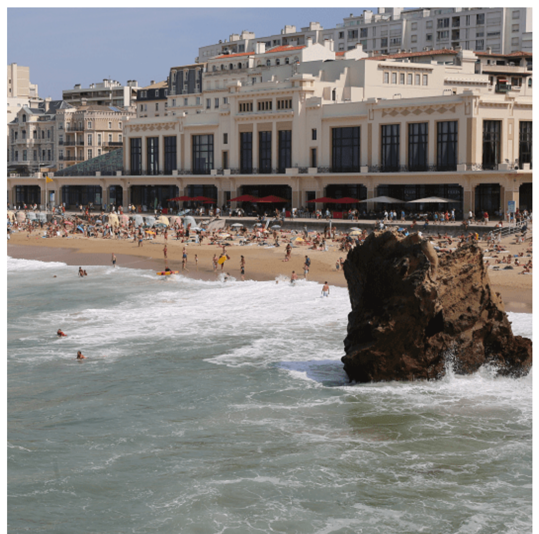
Platja de Biarritz.

El caràcter festiu d'aquest esdeveniment està assegurat per un ambient acollidor, on la gastronomia local es mostra àmpliament mitjançant els còctels durant els quatre tornejos. El País Basc es destaca especialment durant el festival, els festivalers es vesteixen de blanc i vermell i les dones juguen contra homes.●