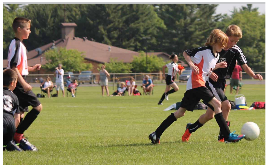
Nens practicant activitats esportives.