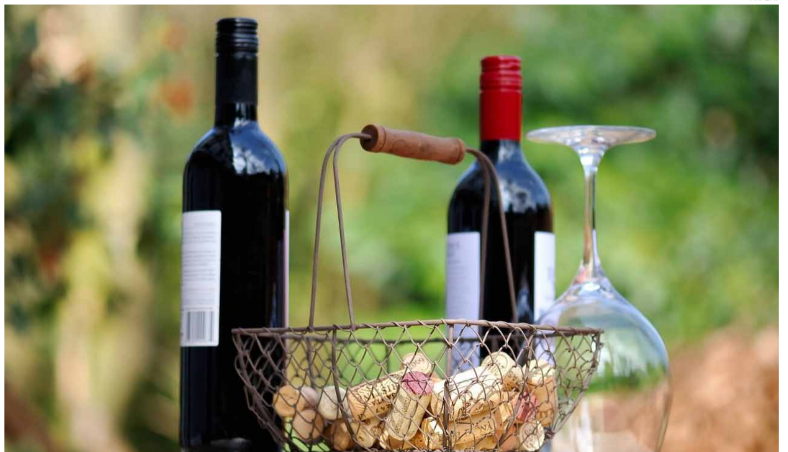
Vi amb denominació d'origen.

Totes les sessions són als jardins de la Biblioteca Central Xavier Amorós. ●