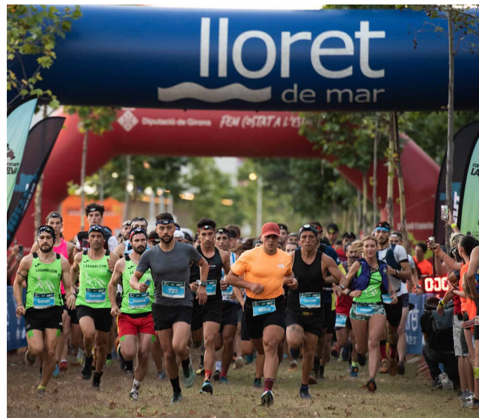
Imatge d'una edició anterior.