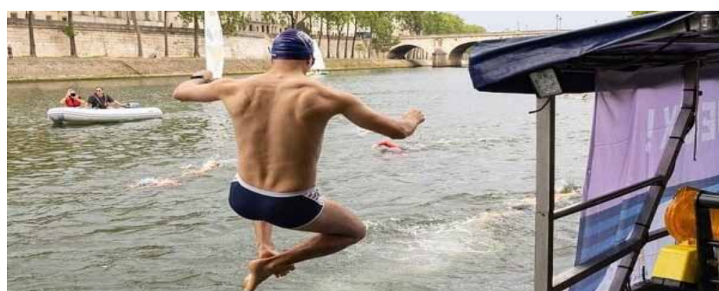
Un esportista entrenant al riu Sena.

Consta d'un cilindre amb un diàmetre de 50 metres i una profunditat de 30 metres, equipat amb 16 columnes que descen-