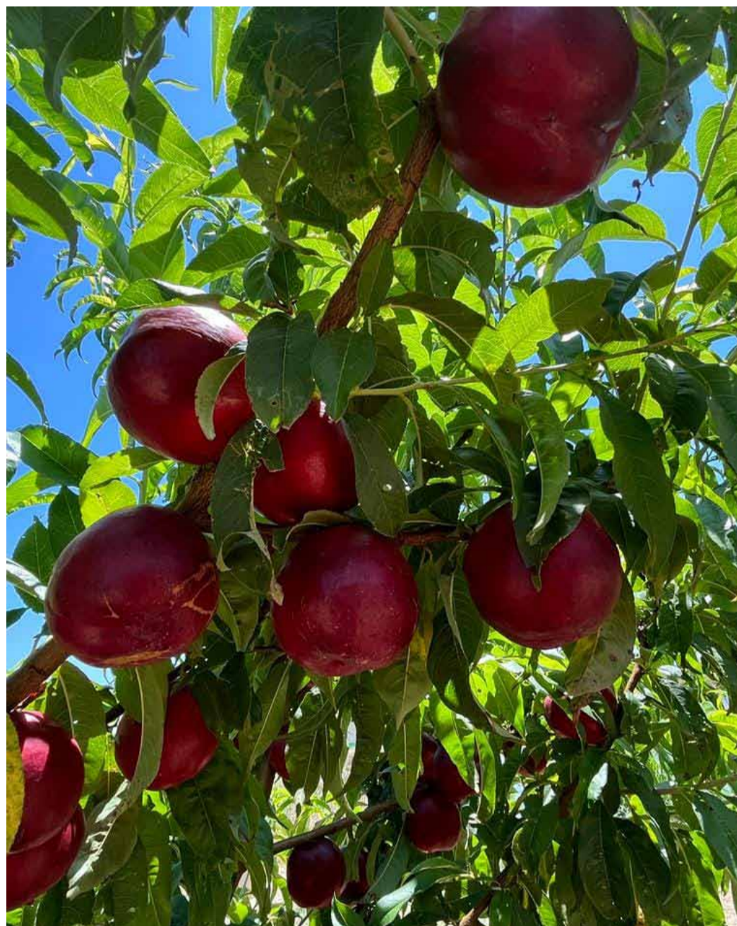
Aitona es posiciona com un lloc ideal pel Fruiturisme