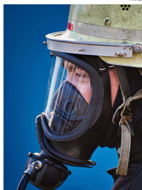
Bomber en un simulacre.

La campanya forestal dels Bombers de Barcelona es va iniciar a principis del mes de juny i estarà activa fins a mitjan setembre. Durant aquest període, el Servei de Protecció Civil, Prevenció i Extinció d'Incendis i