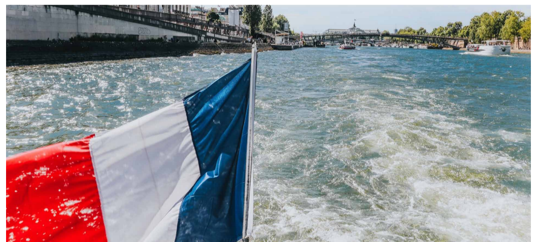
Vaixells navegant pel riu.

La ciutat de París ha invertit 1.400 milions d'euros per sanejar el riu