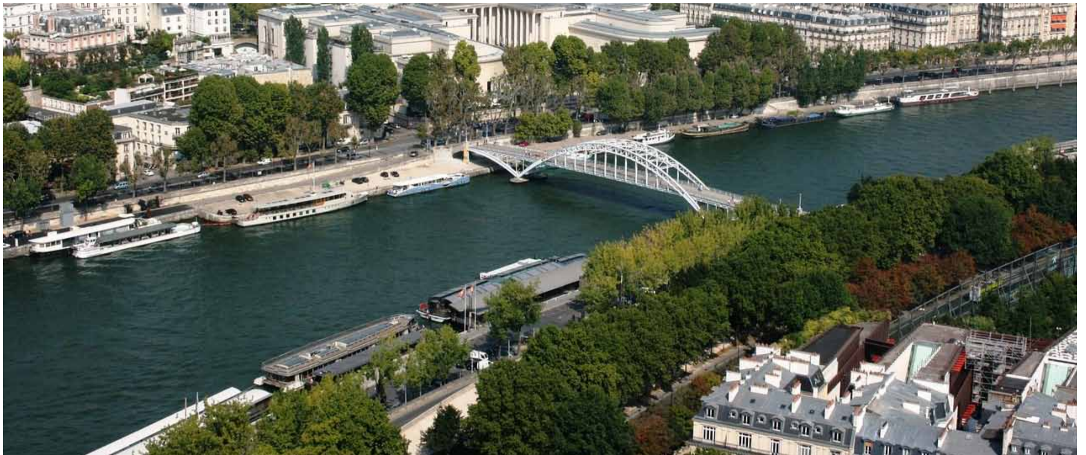
Vista aèria del riu Sena.