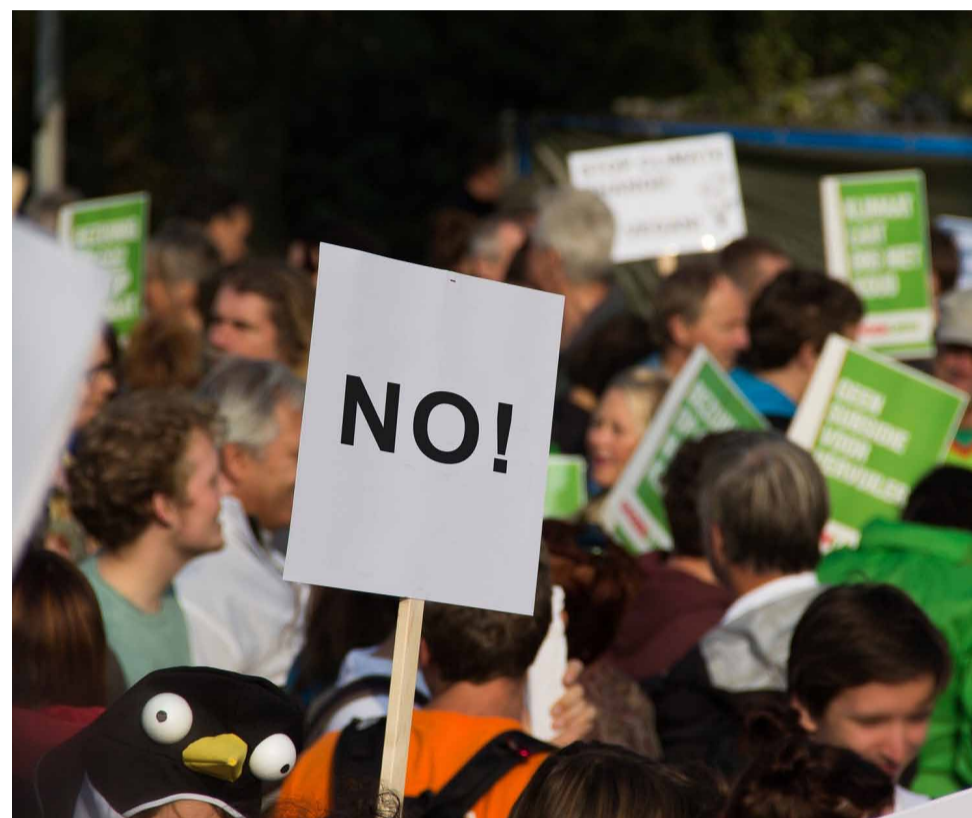
Protesta contra el model turístic.