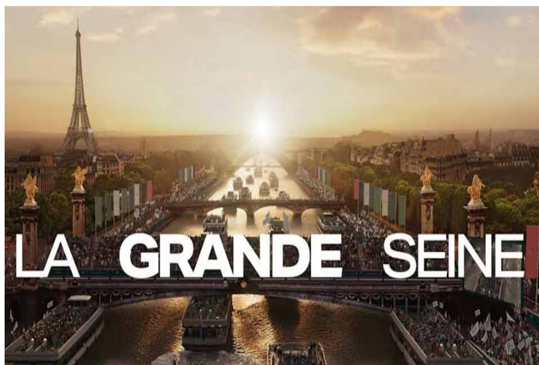
Portada del documental.