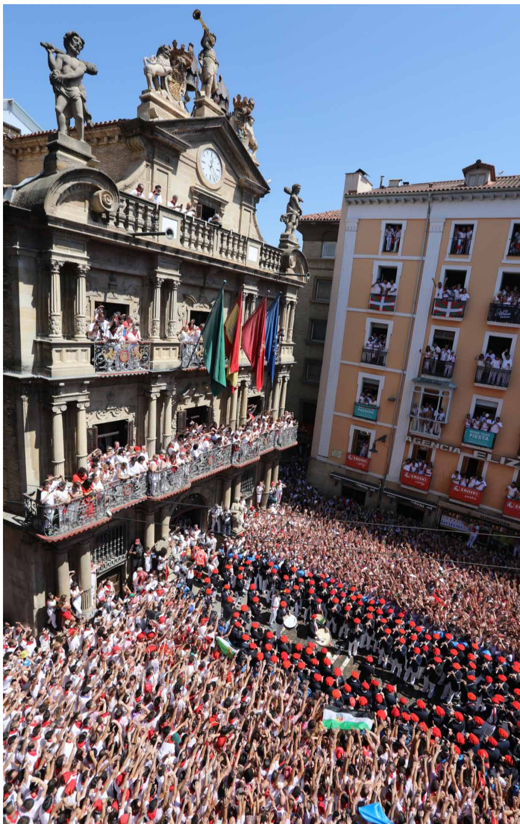
Celebració de San Fermín 2024: el Txupinazo i un dels 'encierros'.