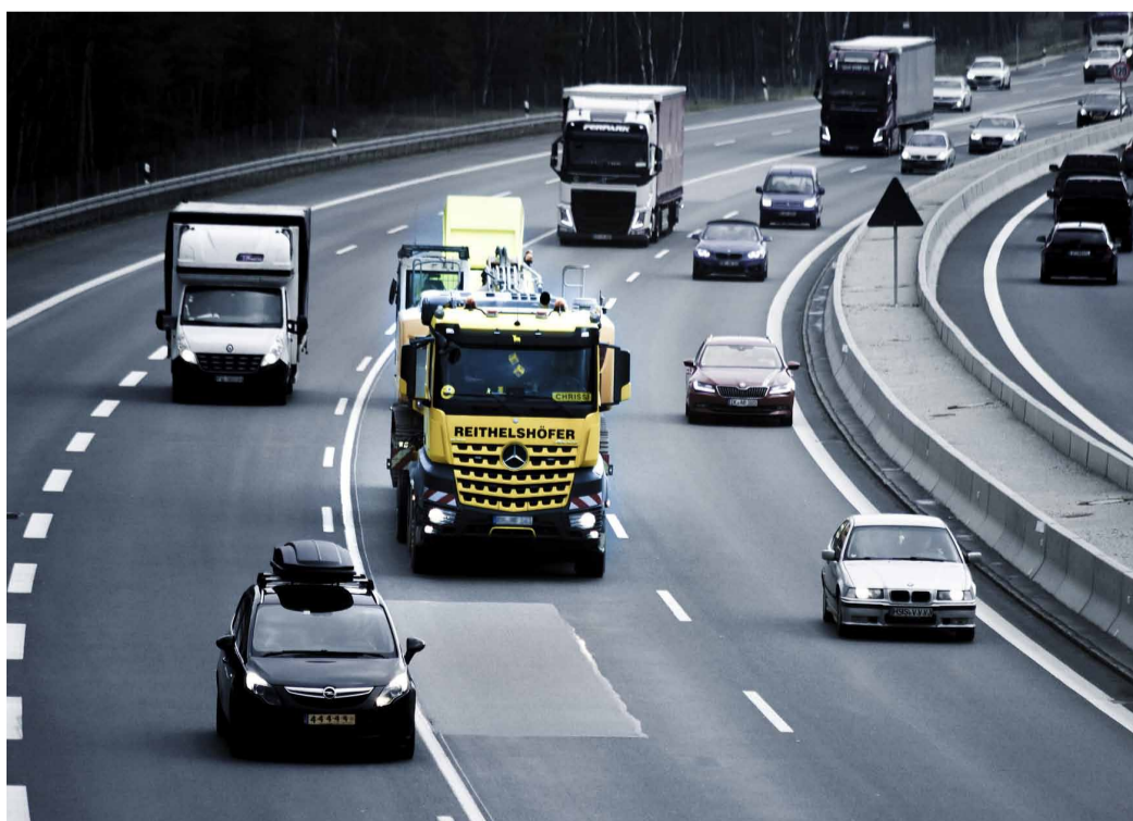
Trànsit a les autopistes.