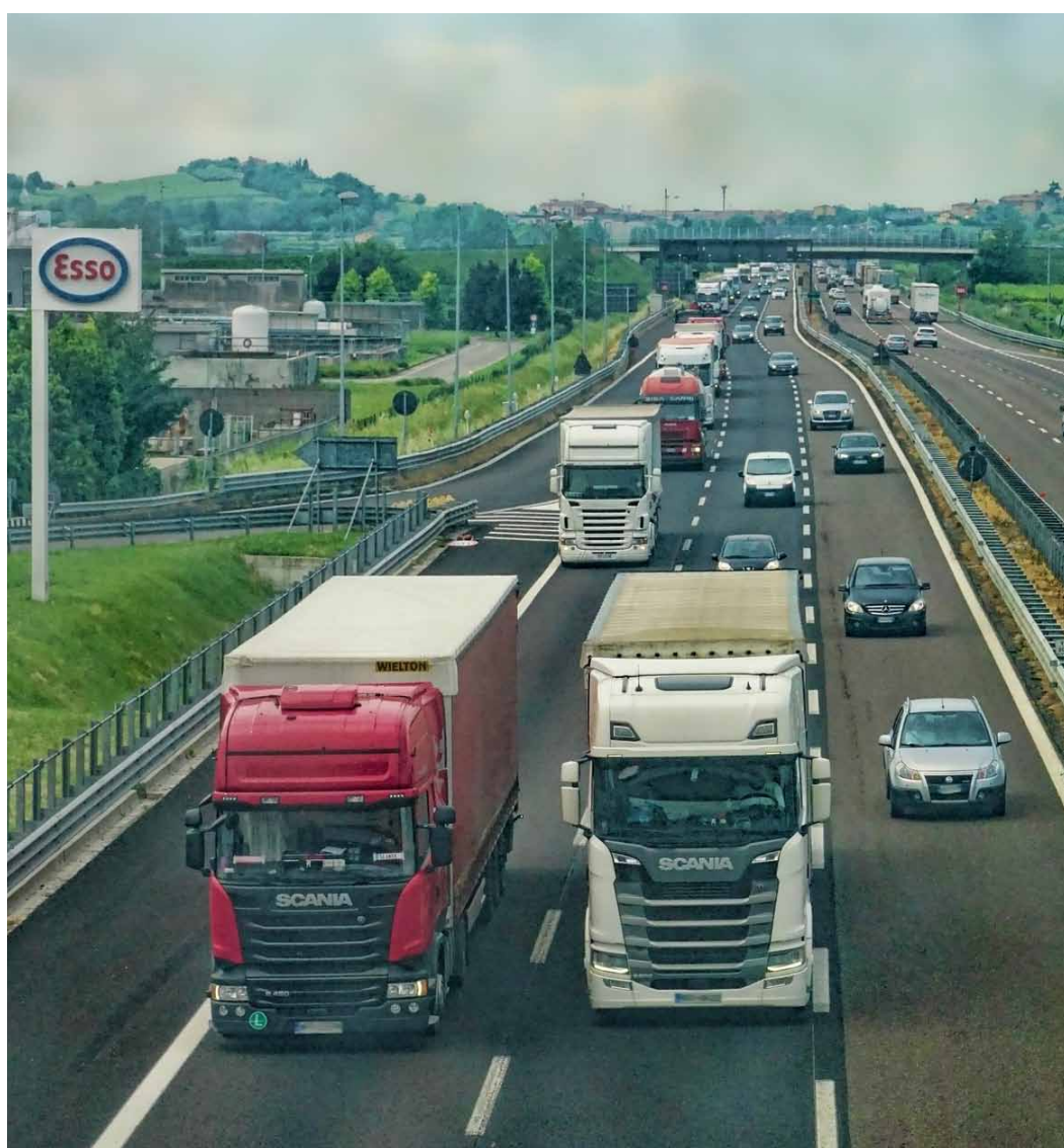
Arteria d'accés a París.