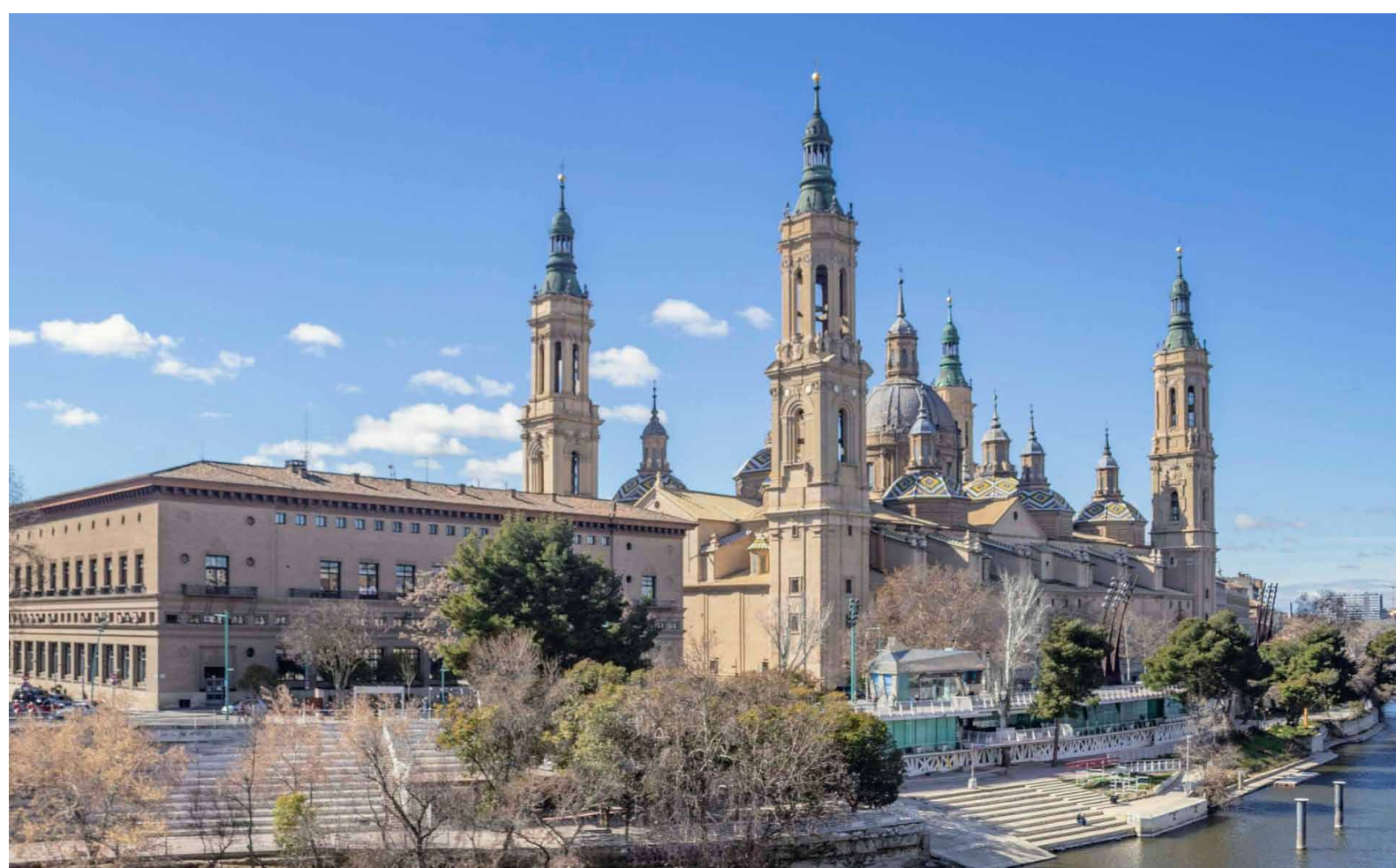
Centre de Saragossa.