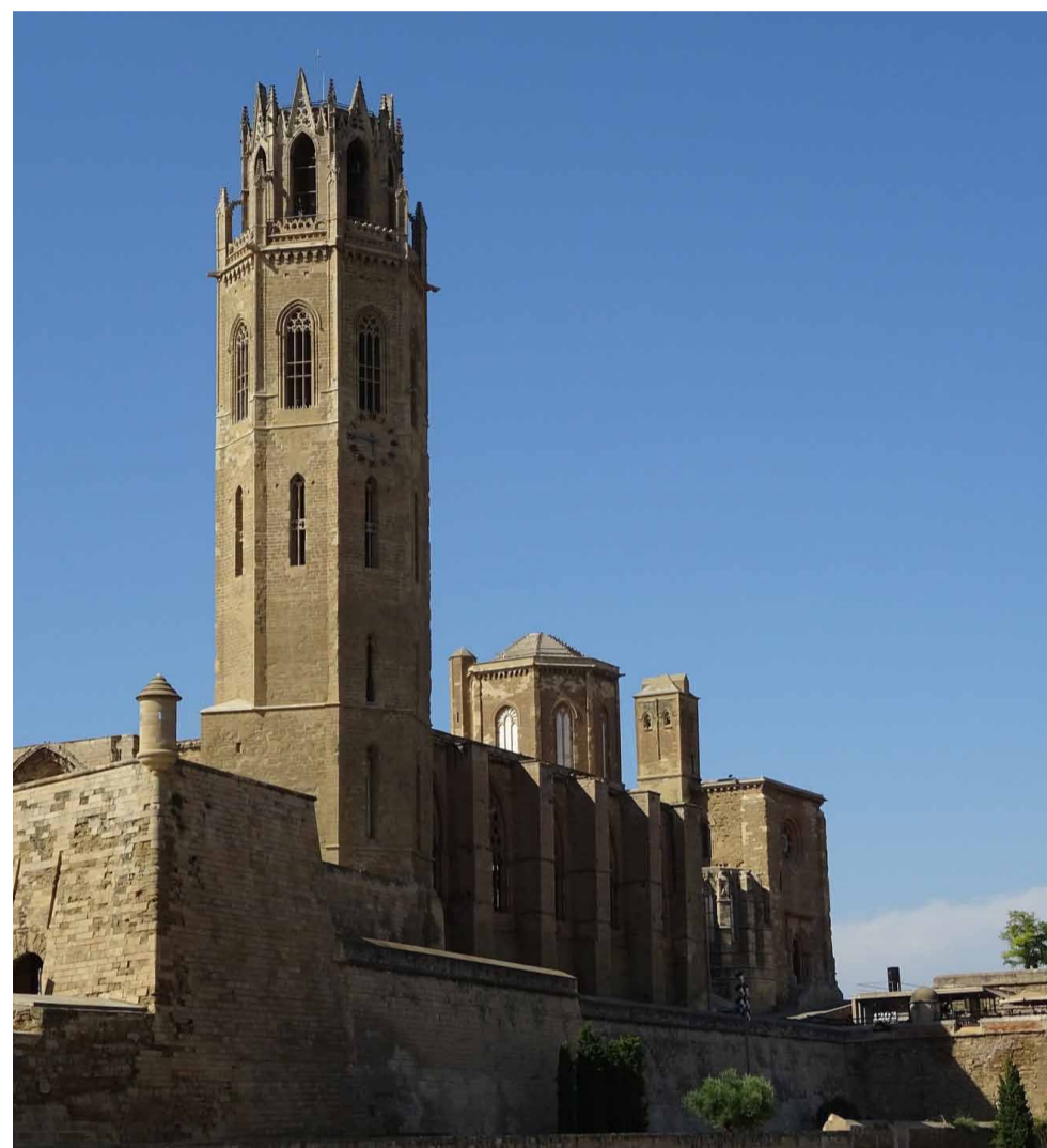
Ciutat de Lleida.