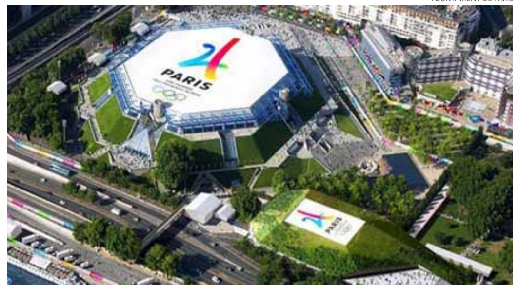
Localitzacions dels Jocs.

Per a les proves de vela, París 2024 navega pel Mediterrani. Gràcies a la seva situació geogràfica, Marsella és una ciutat que mira naturalment al mar, oferint unes condicions excepcionals per a la vela. L'experiència de la ciutat, reconeguda interna-