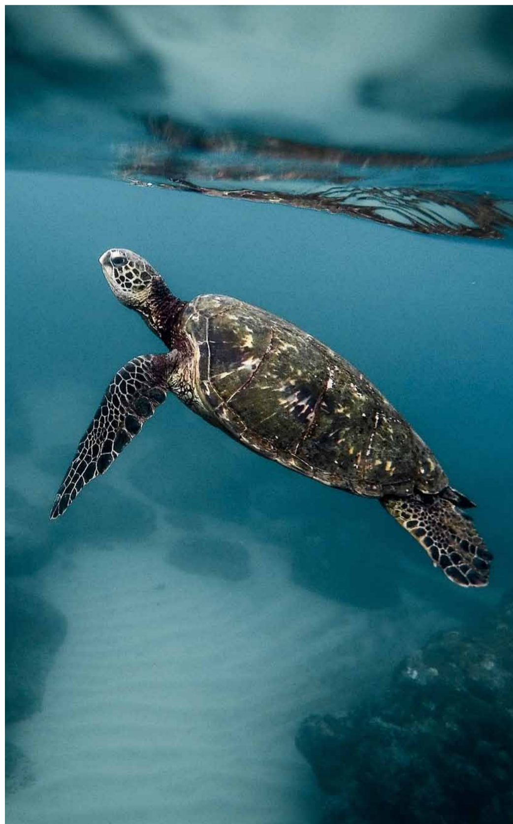
Tortuga a mar obert.

La temporada de cria de la tortuga careta arrenca a principis del mes de juny i es perllonga fins a finals d'octubre. Les mares solen fer els nius entre mitjans de juny i finals de juliol, i les cries comencen a emergir a partir de principis d'agost fins a mitjans o finals d'octubre. La nidificació de tortugues careta a la Mediterrània occidental va començar fa uns 10 o 15 anys, el que indica un canvi de comportament motivat probablement pel canvi climàtic. L'any passat es van localitzar a la costa catalana 10 nius de tortuga careta: 5 al Delta de l'Ebre i la resta a Malgrat Mar, Begur, Coma-ruga, Calafell i Vialdecans. ●