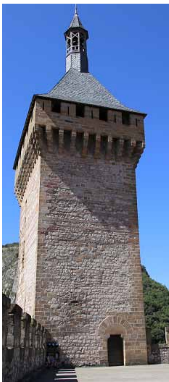
Castell de Foix.