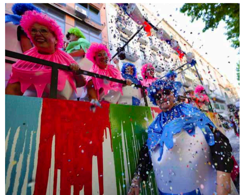
A la esquerra la millor actuació dels Castellers de Lleida per Festa Major, a la dreta correfocs i batalla de flors.